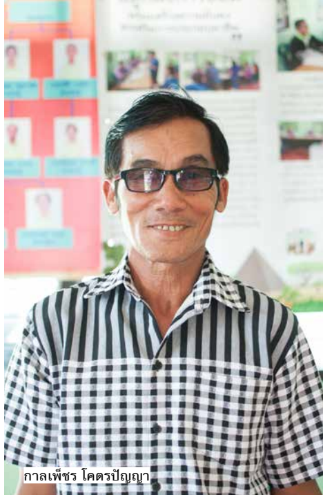
กาลเพชร โคตรปัญญา

และปล่อยกู้ โดยสภาชุมชนของบ้านกุดดุก เป็นหนึ่งในผลลัพธ์ของโครงการนี้ แต่สมัยนั้น เรียกว่ากลุ่มออมทรัพย์