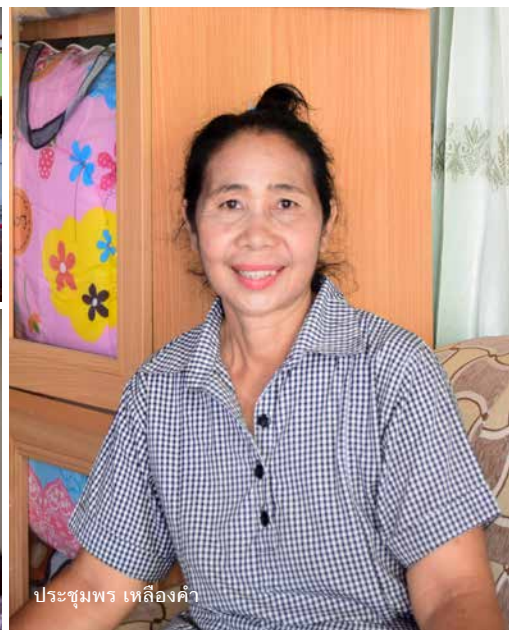
ประชุมพร เหลืองคำ