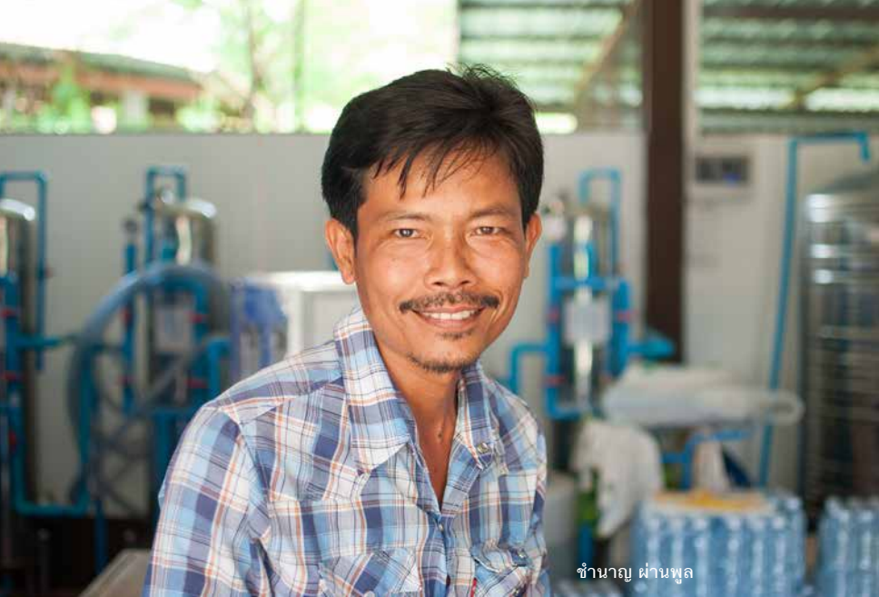
ชำนาญ ผ่านพูล

ละหนึ่งถึง ถ้าอยากได้เพิ่ม ซื้อโบละ 100 บาท มาเติมเองคิดค่าน้ำเพียง 5 บาท ผิดกับไปซื้อจากร้านค้า ที่คิดราคาถึง 15 บาท