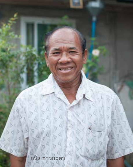
พอล ชาวกะตา

ได้ผลผลิตข้าวต่อไร่จาก 40 ถัง เพิ่มเป็น 80 ถัง จนได้รับรางวัลที่ 1 ในการประกวดแหล่งน้ำขนาดเล็ก ซึ่งจัดโดยสำนักนายกรัฐมนตรี ในครั้งนั้นกลุ่มได้เงินรางวัลมา 300,000 บาท