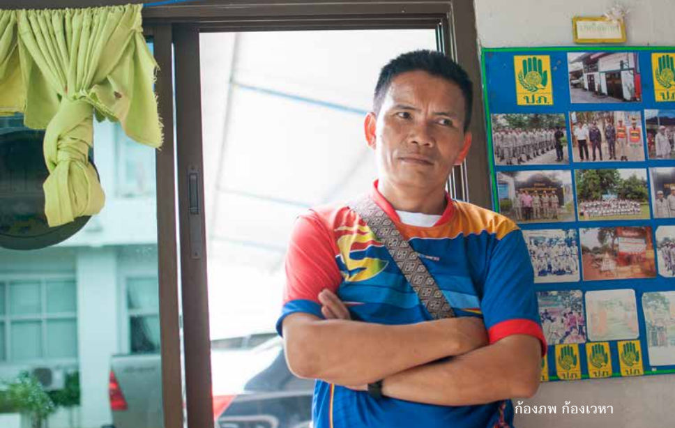
กิ่งภพ ก้องเวหา

รักษาพยาบาลเบื้องต้น โดยรองรับทั้ง 8 หมู่บ้าน ส่วนกรณีเจ็บป่วยฉุกเฉิน ทางเทศบาลตำบลหนองฮีบุตรจัดรถกู้ชีพไว้ให้ พร้อมเวรประจำรถตลอด 24 ชั่วโมง