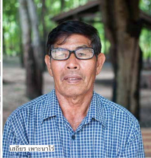
เสถียร เพาะนาไร่