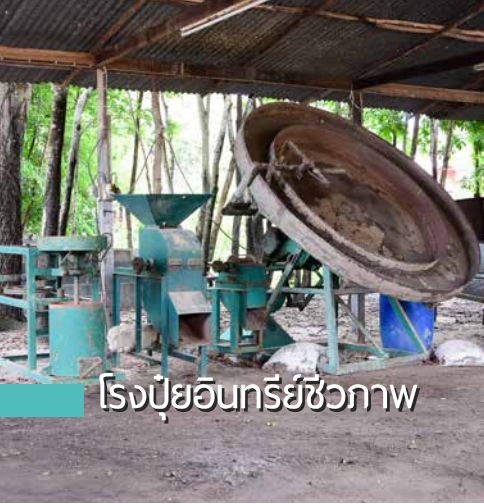
โรงบดอินทรีย์ชีวภาพ