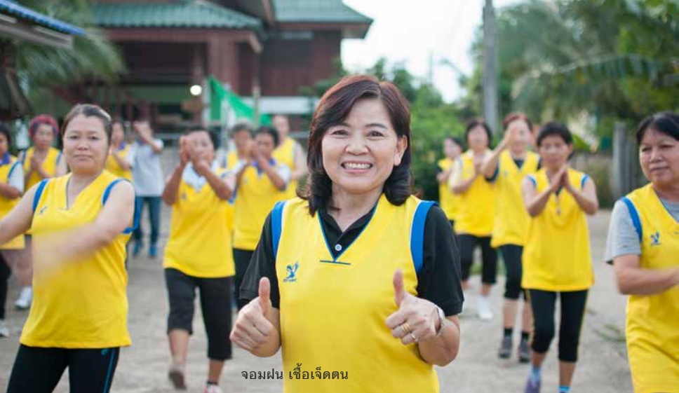
จอมฝน เชื้อเจ็ดคน