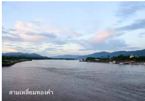
สามเหลี่ยมทองคำ