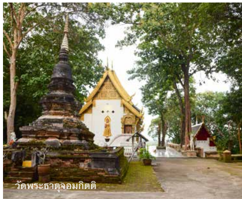
วัดพระธาตุจอมกิติ