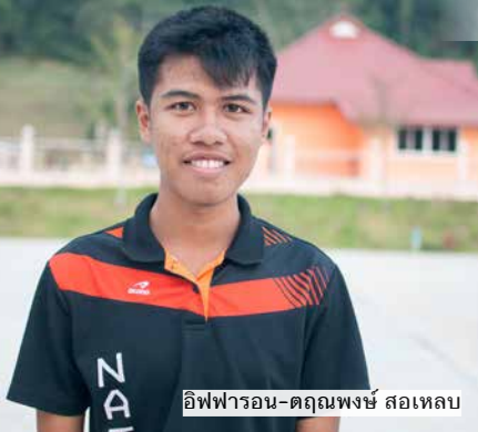
อิฟฟารอน-ตฤณพงษ์ สอเทลบ