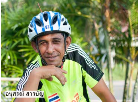
อนุสรณ์ สารบัญญัติ