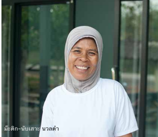
มีะติก-นับเสาะ นวลดำ