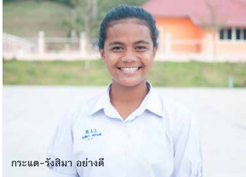
กระแต-รังลิมา อย่างดี

เท่าที่ผมทราบ ทุกท้องถิ่นในประเทศไทย มีสภาเด็กและเยาวชนของตำบลนาทอน รู้จักกันภายใต้ชื่อสภาพเมืองเด็กและเยาวชน สภานี้มีที่มาจากพระราชบัญญัติส่งเสริมการพัฒนาเด็กและเยาวชนแห่งชาติ พ.ศ.2550 สารสำคัญคือให้จัดตั้งสภาเด็กและเยาวชน ตั้งแต่ระดับจังหวัด อำเภอ เรื่อยมาจนถึง ตำบล เพื่อเป็นกลไกส่งเสริมการเรียนรู้ และพัฒนาศักยภาพเด็กและเยาวชน