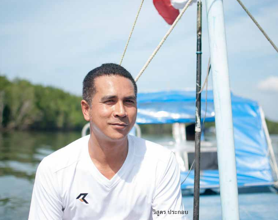
วิสูตร ประกอบ

กระบี่ เป็นเนินทรายที่ไหลพันผิวน้ำขึ้นมา จุดที่สองพาไปดูปูก้ามดาบ จุดที่สามไปให้อาหารนกเหยี่ยว จุดที่สี่ไปดูฟอสซิลที่เขาดะบัน จุดที่ห้าไปดูสุสานหอย จุดที่หกไปดูค้างคาวแม่ไก่นับแสนบินออกจากรัง และจุดที่เจ็ด ล่องแพดูวิถีชีวิตป่าชายเลน ประมงพื้นบ้าน