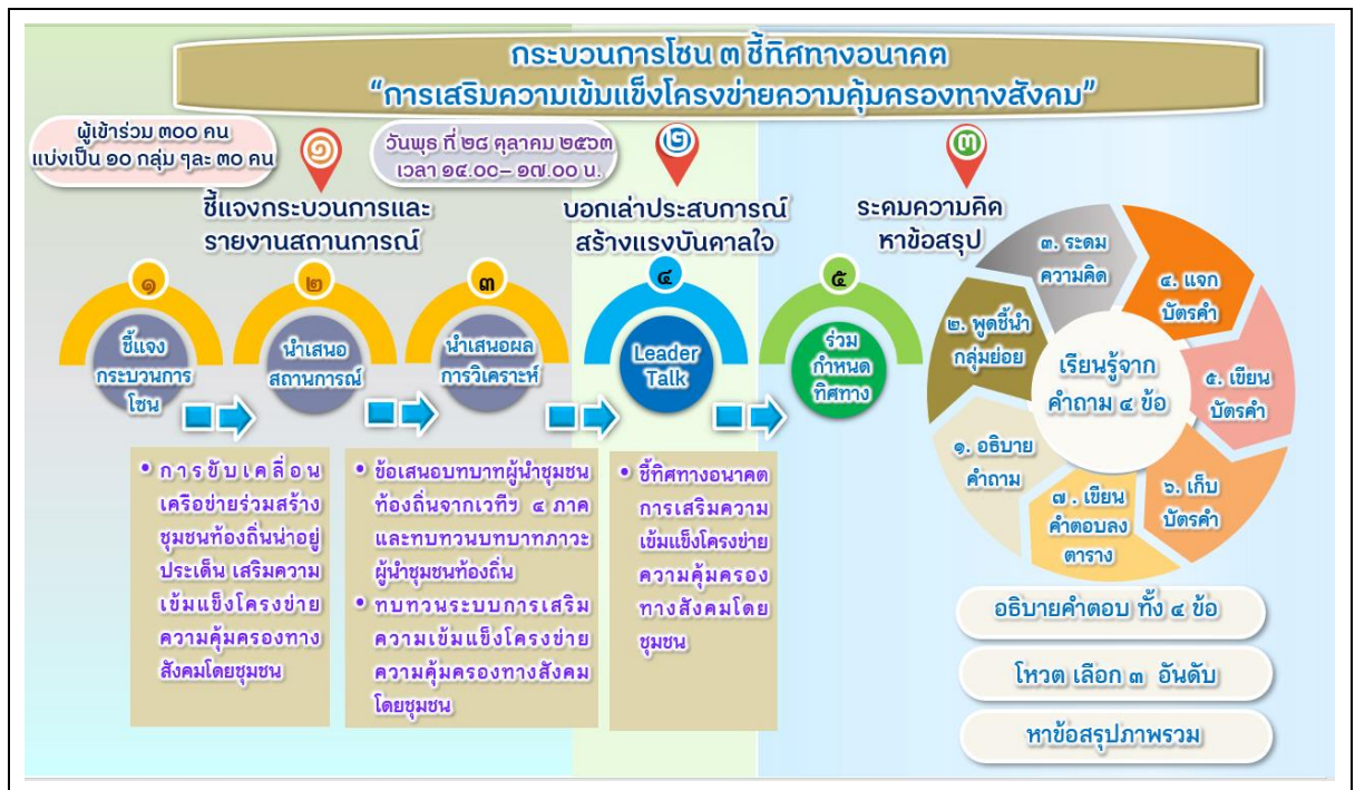
แผนภาพที่ ๑ ภาพรวมกระบวนการโซน ๓ ชีทิจทางอนาคต “การเสริมความเข้มแข็งโครงข่ายความคุ้มครองทางสังคมโดยชุมชน”