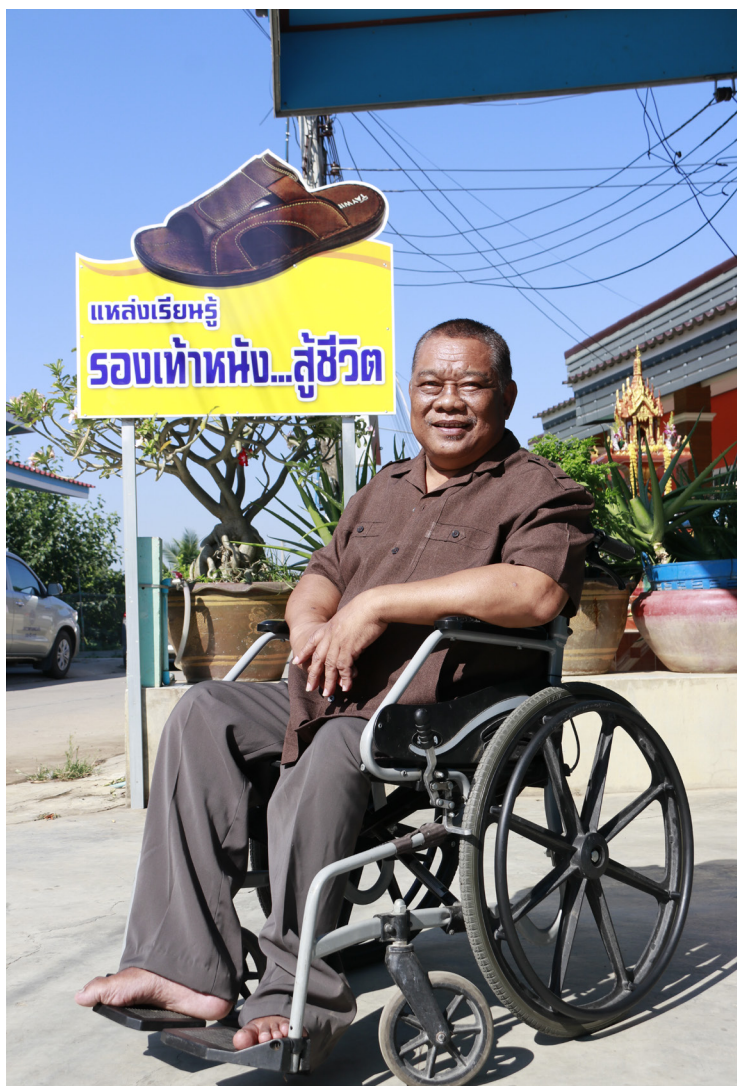
ดอกดิน ไพลี