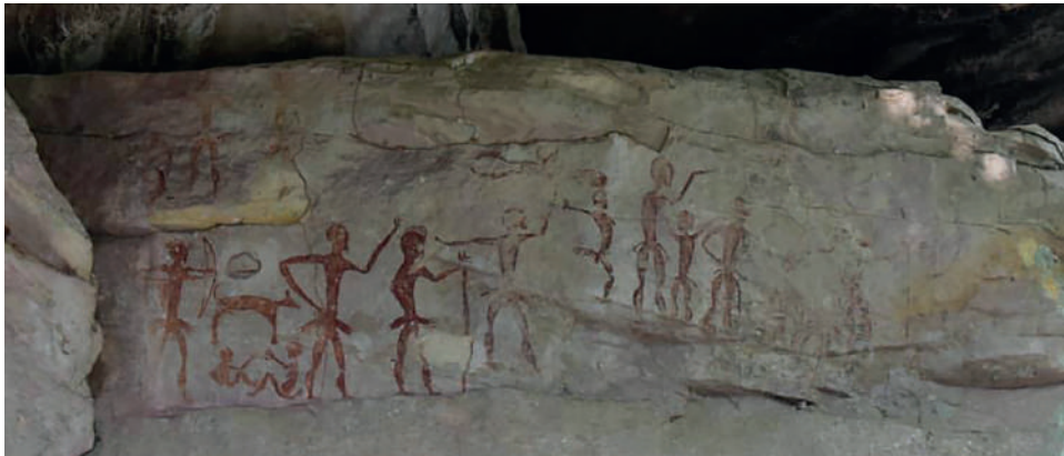
▲ ภาพเขียนสีโบราณ อายุ 4,000 ปี แสดงให้เห็นถึงการแต่งกายและพิธีกรรม