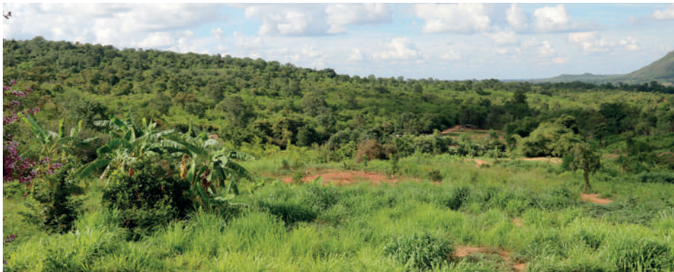
▼ ลักษณะภูมิประเทศ ตำบลมะเกลือใหม่ อำเภอสูงเนิน