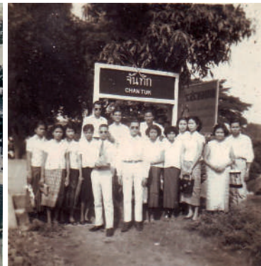
▲ ร่องรอยเมืองจันทักในอดีต ปรากฏเป็นชื่อสถานีรถไฟแห่งหนึ่งในอำเภอปากช่อง