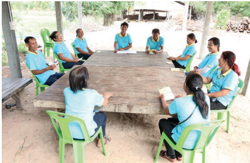
สารคดีท่องเที่ยวชุมชน 32 ตระเวนส่อง สะอาดสมบูรณ์