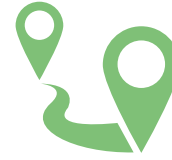
ตระเวนส่อง สะอาดสมบูรณ์