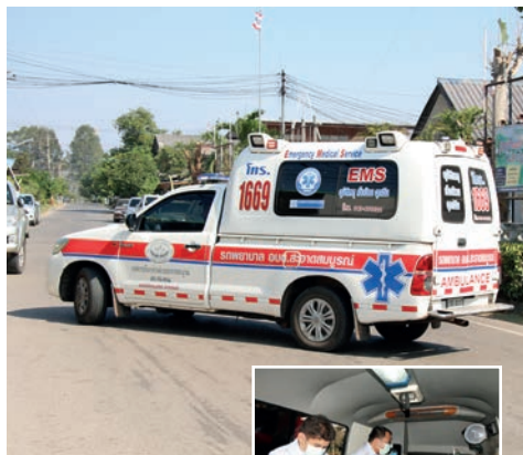
สารคดีท่องเที่ยวชุมชน