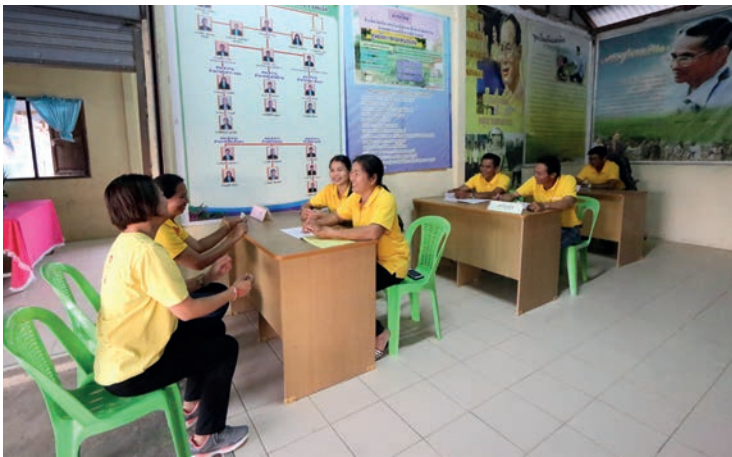
สารคดีท่องเที่ยวชุมชน