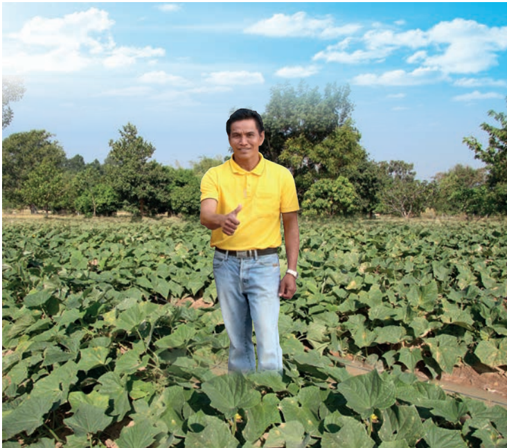
คำตา กัลลา

ประธานกลุ่มเกษตรกรพึ่งพาตนเอง บ้านป่าเพิ่ม หมู่ 11