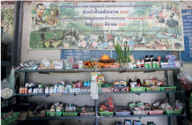
สารคดีท่องเที่ยวชุมชน