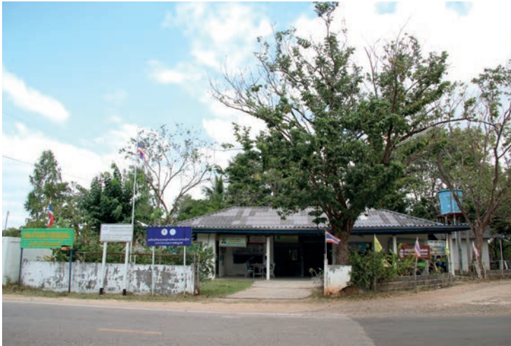
สารคดีท่องเที่ยวชุมชน 20 ตระเวนส่อง สะอาดสมบูรณ์