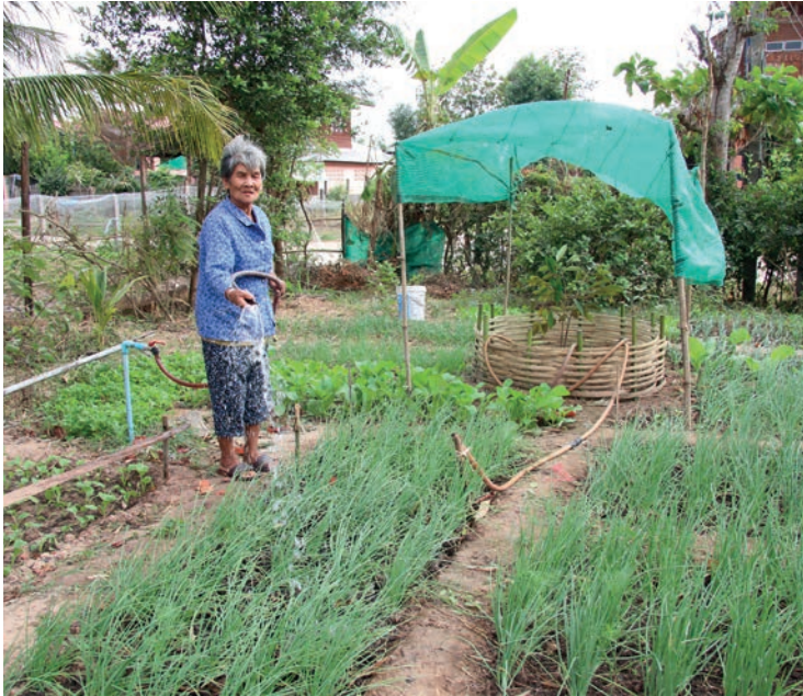
สารคดีท่องเที่ยวชุมชน