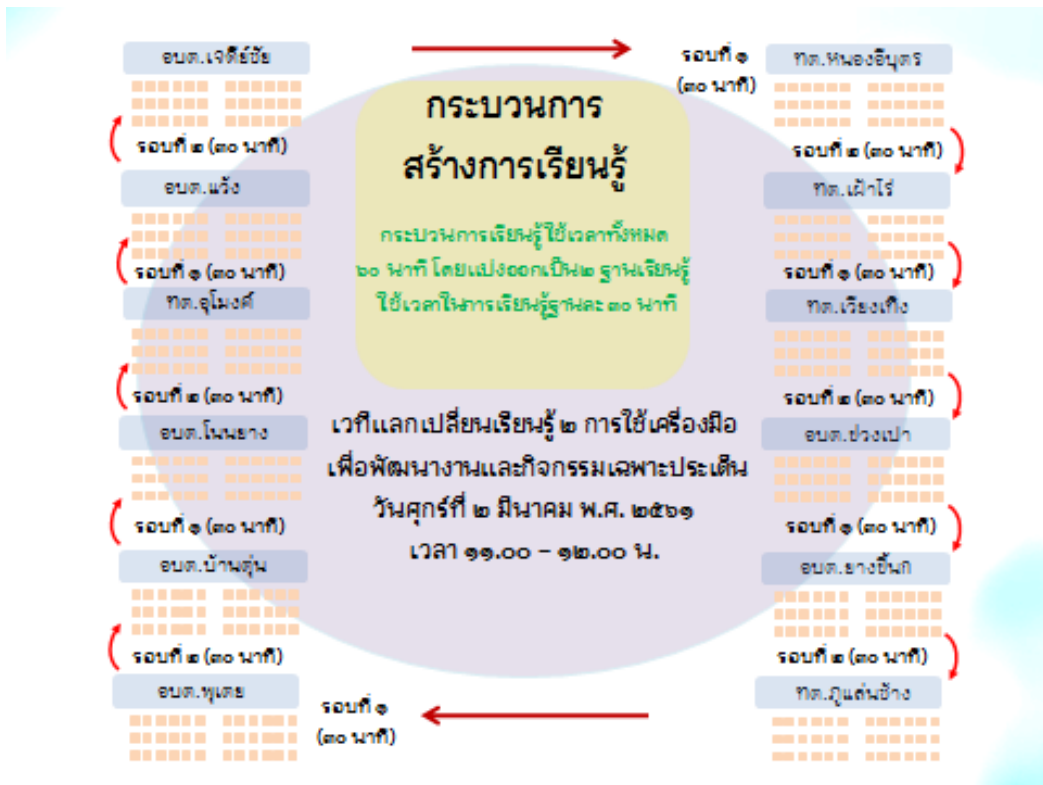
แผนภาพที่ ๓ กระบวนการเรียนรู้การใช้เครื่องมือของชุมชนท้องถิ่นเพื่อพัฒนานวัตกรรม