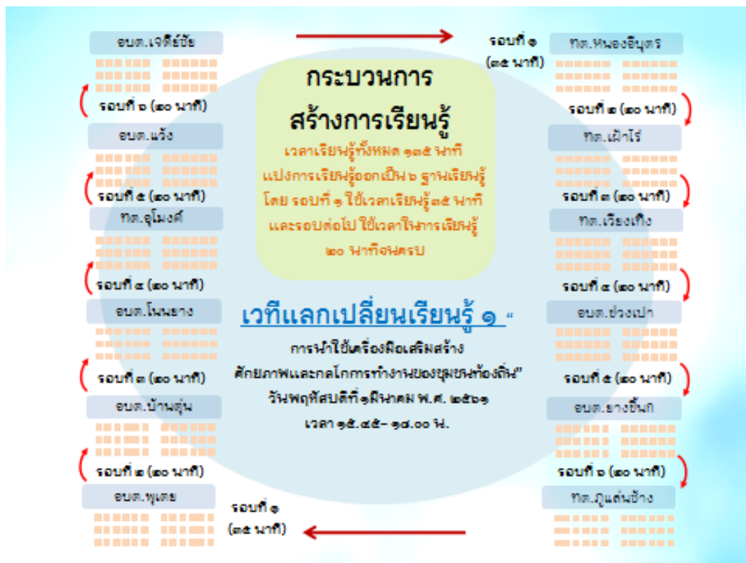
แผนภาพที่ ๒ กระบวนการเรียนรู้การนำใช้เครื่องมือของชุมชนท้องถิ่นเพื่อสร้างการเรียนรู้