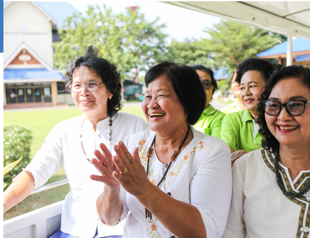
รอยยิ้มและความสุขของผู้สูงอายุชาวทำงานที่ได้รับการดูแลจาก อบต. ทำงานเป็นอย่างดี

ประกอบกับหลักคิดการทำงานอย่าง Banana Solution หรือการทำทุกอย่างให้เป็นเรื่องง่าย ตรงไปตรงมา ไม่มีขั้นตอนซับซ้อน ทำให้ทุก ๆ โครงการประสบความสำเร็จเป็นอย่างดี