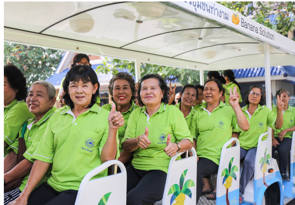
รอยยิ้มของผู้สูงอายุตำบลทำงาน

นอกจากเรื่องของการดูแลและพัฒนาคุณภาพชีวิตผู้สูงอายุใน 4 มิติที่กล่าวไปข้างต้นแล้ว ทาง สสส. ยังได้ช่วยกำหนดโจทย์ในการขับเคลื่อนงานให้มีประสิทธิภาพมากขึ้น ด้วยกรอบ 5อ. และ 5ก. ซึ่งเป็นหลักคิดในการทำงานที่ครอบคลุมการพัฒนาคุณภาพชีวิตในทุก ๆ ด้าน