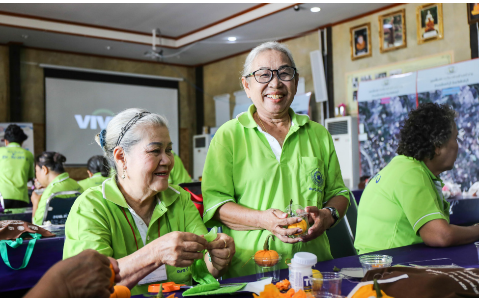
ผู้สูงอายุรวมกลุ่มทำกิจกรรมเพื่อสร้างเสริมรายได้