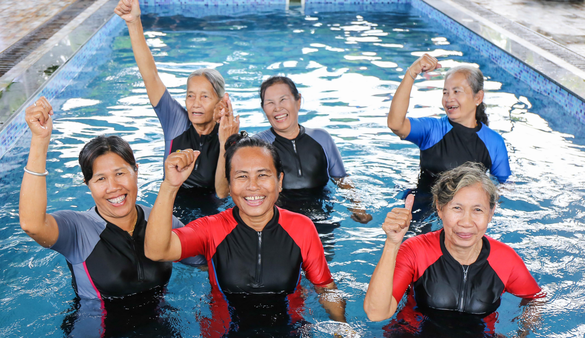
โรงเรียนผู้นำสูงวัยตำบลท่างามสร้างแหล่งเรียนรู้ที่ไม่มีวันหมดอายุให้กับผู้สูงอายุในชุมชน