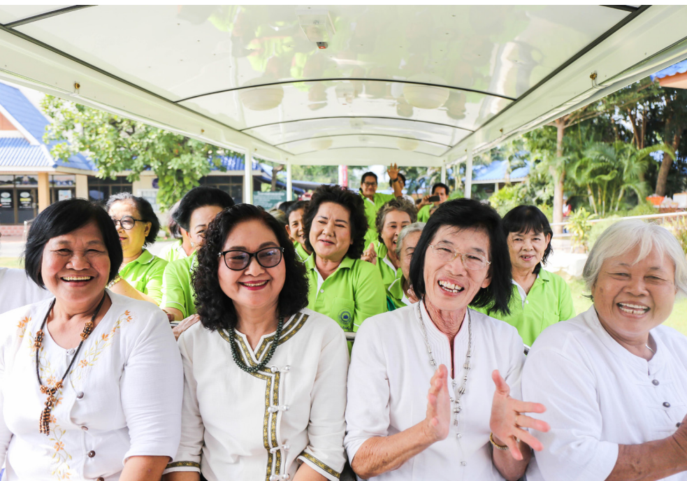
ผู้สูงอายุนำเที่ยวในโครงการท่องเที่ยวชุมชนทำงาน

การส่งเสริมอาชีพจึงเป็นแนวทางในการช่วยเหลือผู้สูงอายุให้มี รายได้ ด้วยการนำภูมิปัญญาท้องถิ่นหรือทักษะที่เคยมีกลับมาสร้างเป็น ผลิตภัณฑ์ เช่น กระเป๋าผ้า งานจักสาน หรือการทำขนมที่มีส่วนผสมของ สมุนไพรที่ปลูกได้ในพื้นที่