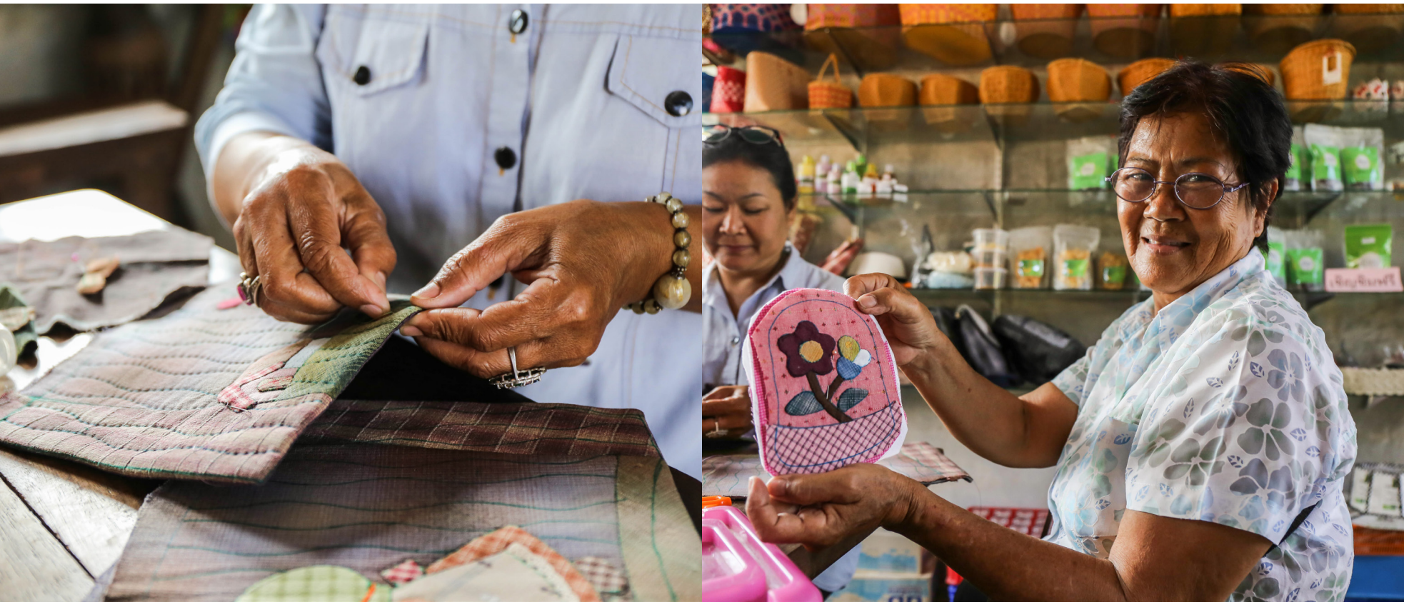
ผู้สูงอายุตำบลท่างาม มีส่วนร่วมในการผลิตสินค้าและออกแบบลวดลาย เพื่อออกจำหน่ายสร้างรายได้เสริมให้กับกลุ่มสตรีสดีสลายนคราม