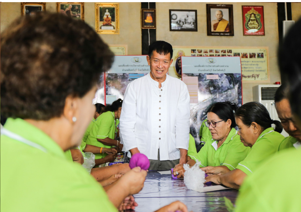
ผู้สูงอายุพบปะพูดคุยกันช่วยคลายเหงาและทำให้มีความสุขจิตดีขึ้น