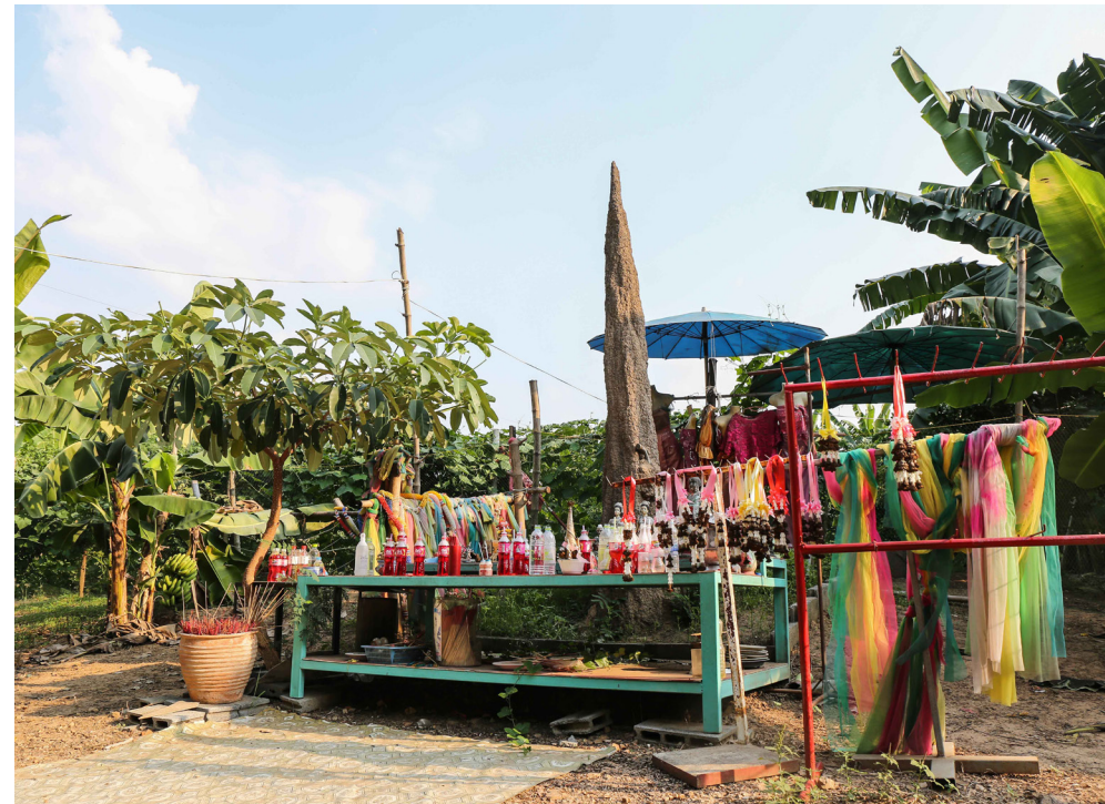
ตู้บริจาคเงินสำหรับช่วยเหลือผู้ประสบปัญหาทางสังคม อยู่ข้าง ๆ จอมปลวก จึงเรียกว่า ‘กองทุนจอมปลวก’

จากชาวท่างามด้วยกันเองคือ ‘กองทุนช่วยเหลือผู้ประสบปัญหาทางสังคม’ หรือที่ชาวท่างามเรียกติดปากว่า ‘กองทุนจอมปลวก’ เกิดจากการที่ชาวบ้านเสี่ยงโชคลอตเตอรี่ถูกเป็นเงินจำนวนมาก และอยากจะบริจาคเงินช่วยเหลือผู้อื่น จึงมีการตั้งตู้รับบริจาคไว้ที่ข้าง ๆ จอมปลวก เพื่อให้คนที่ถูกลอตเตอรี่นำเงินมาบริจาคใส่ตู้ไว้ เป็นเงินกองทุนที่สามารถนำไปช่วยเหลือผู้อื่นได้อีกทางหนึ่ง