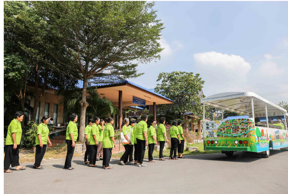
อบต. ทำงาน ผลักดันและลงมือปฏิบัติเพื่อให้ความสุขทั้งกายและใจกับผู้สูงอายุในตำบล

ทั้งมิติต่างๆ ที่กล่าวมา จึงเป็นหนทางสร้างความสุขทั้งกายและใจของผู้สูงอายุ ที่ อบต. ทำงานตั้งใจผลักดันและลงมือปฏิบัติให้เกิดขึ้นจริงแล้ว