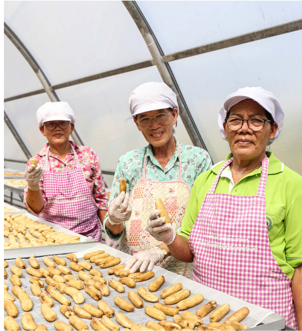
กล้วยแปรรูปจากโรงกล้วยตากพลังงานแสงอาทิตย์ เป็นการส่งเสริมอาชีพให้ผู้สูงอายุมีรายได้