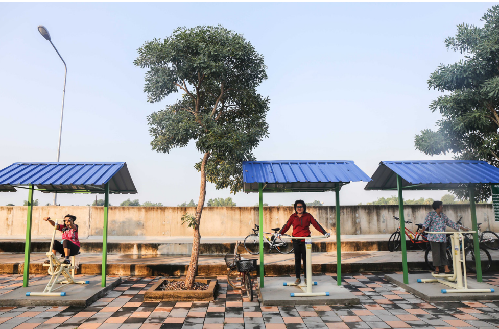
พื้นที่ในการพบปะและออกกำลังกายร่วมกันของผู้สูงอายุในชุมชน

“การทำงานสังคม จะทำเหมือนโครงการสร้างถนนหรือสร้างสะพานไม่ได้ เพราะตรงนั้นใช้เวลาแค่เก้าสิบวันร้อยวันก็เสร็จเห็นเป็นรูปร่างแล้ว แต่งานสังคมและงานคุณภาพชีวิตนั้นต้องอาศัยการทำต่อเนื่องไปเรื่อยๆ ทำวันนี้อีกห้าปีสิบปีถึงจะเห็นผล เพราะฉะนั้นเราจึงต้องทำอย่างต่อเนื่อง และทำโดยไม่เปลี่ยนจุดประสงค์ไปตลอด”