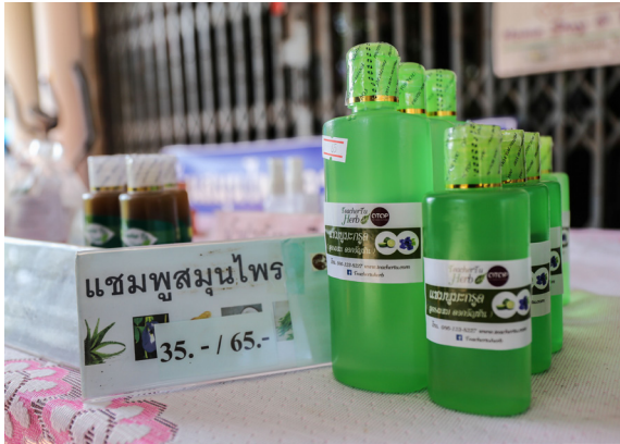
แชมพูสมุนไพรจากส่วนประกอบที่หาได้ในพื้นที่ตำบลท่างาม

จากความสำเร็จในการพึ่งพาตนเองในตอนแรก นำไปสู่การสร้างรายได้เป็นอย่างดี จนทำให้ผลิตภัณฑ์บ้านสมุนไพรครุฑุ์ได้ขึ้นทะเบียนเป็นผลิตภัณฑ์โอท็อปของตำบลท่างาม ส่งจำหน่ายไปยังที่พักหรือโรงแรมหลายแห่ง และเปลี่ยนบ้านให้กลายเป็นศูนย์เรียนรู้สมุนไพรใกล้ตัว ที่พร้อมต้อนรับทุกคนที่อยากจะเรียนรู้อยู่เสมอ