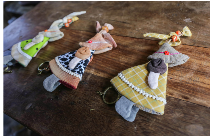
สินค้าแฮนด์เมดจากกลุ่มสตรีสไตลสายคราม ได้แก่ กระเป๋าสตางค์ พวงกุญแจและกระเป๋าถือ เป็นหนึ่งในสินค้าไอทีโอของตำบลท่างาม