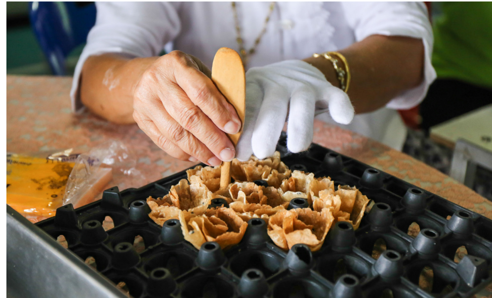
ขนมทองม้วนสมุนไพรที่มีส่วนผสมของงาและใบมะกรูด ของฝากขึ้นชื่อของตำบลท่างาม

นอกจากผลิตภัณฑ์และอาชีพต่าง ๆ ที่บอกเล่าไปข้างต้นแล้ว อีกหนึ่งผลผลิตจากผู้สูงอายุตำบลท่างาม คือ ขนมทองม้วน ที่มีเอกลักษณ์คือไม่ใช้การม้วนแบบปกติ แต่ใช้การขึ้นรูปด้วยแผงไซ้ ทำให้ขนมทองม้วนเป็นรูปทรงคล้ายดอกไม้ สวยงามน่ากิน รวมถึงมีการผสมสมุนไพรอย่าง เมล็ดงาและใบมะกรูด ทำให้มีรสชาติอร่อยและได้ประโยชน์จากสมุนไพร ขนมทองม้วนสมุนไพรจึงเป็นหนึ่งในเมนูอาหารชุมชนสำหรับผู้สูงอายุ และเป็นของฝากติดไม้ติดมือสำหรับแขกทุกคนที่มาเยือนตำบลท่างาม