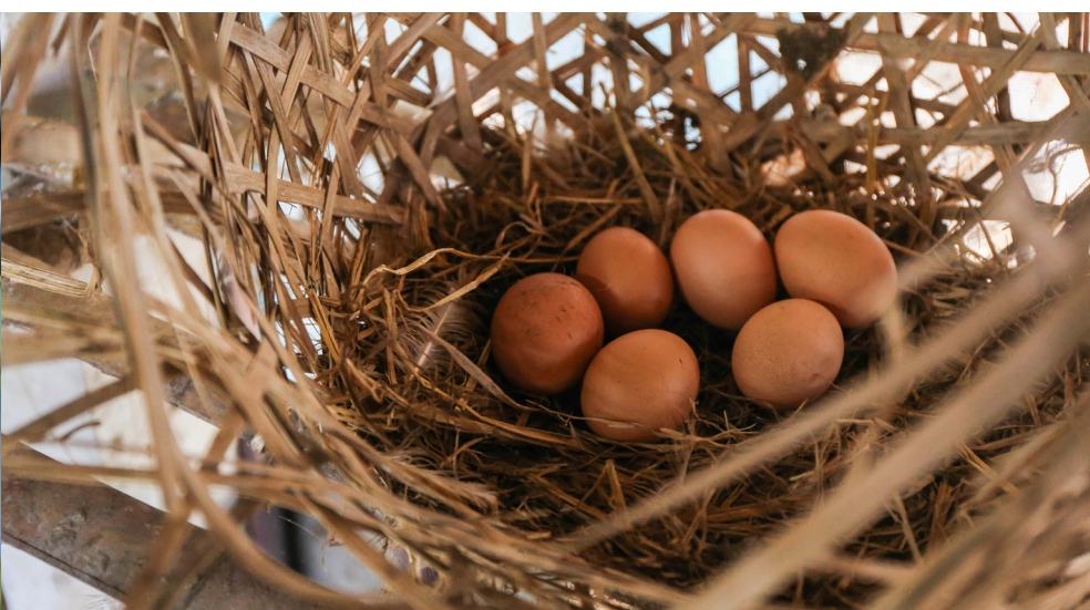
การปลูกผักและการเลี้ยงไก่แบบออร์แกนิกทำให้ปลอดภัยทั้งคนปลูกและคนกิน