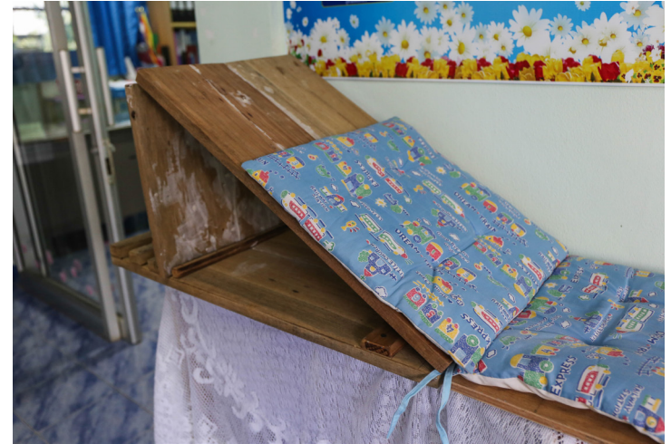
เตียงปรับระดับสำหรับผู้ป่วยติดเตียงที่ประยุกต์จากวัสดุที่หาได้ในพื้นที่

นอกจากเรื่องของอุปกรณ์แล้ว ขณะนี้ยังมีการพัฒนาระบบลงทะเบียนผู้สูงอายุแบบออนไลน์ผ่านแอปพลิเคชัน เพื่อให้การเข้าถึงการดูแลไม่ตกหล่นและเป็นไปอย่างสะดวกมากขึ้น ซึ่งกำลังอยู่ในขั้นตอนของการพัฒนาเพื่อให้สามารถใช้งานได้จริงในอนาคต