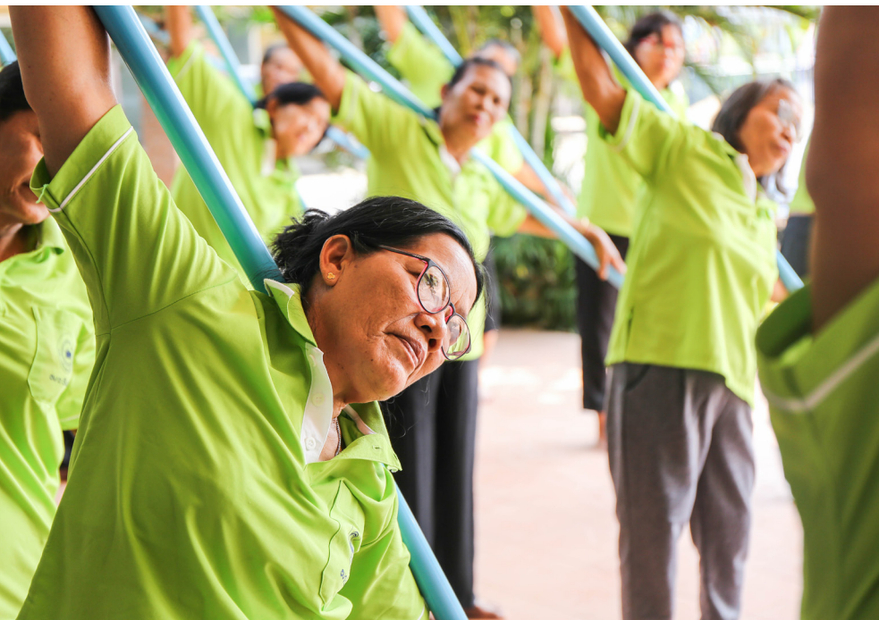
การทำกายบริหารด้วยไม้พลองช่วยยืดเหยียดกล้ามเนื้อ