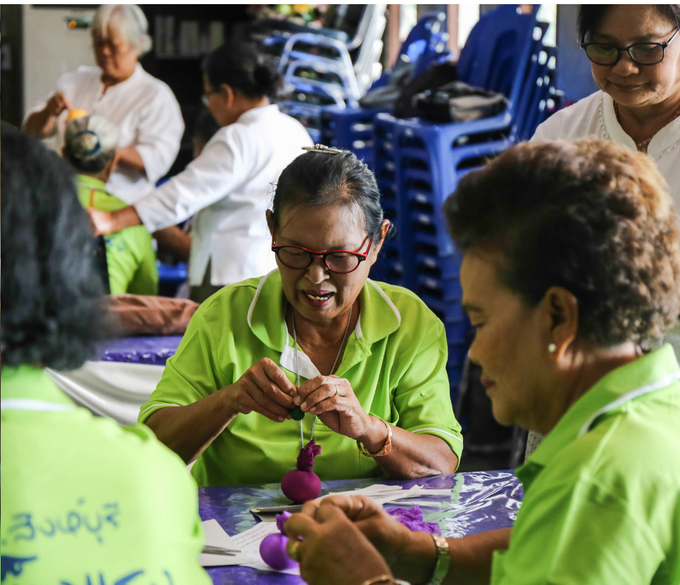
ผู้สูงอายุรวมกลุ่มทำกิจกรรมเพื่อสร้างเสริมรายได้