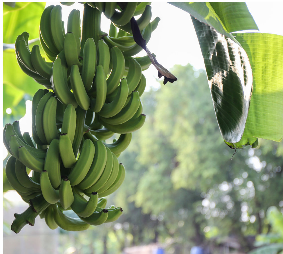
กล้วยที่ปลูกโดยใช้ปุ๋ยหมักจากกากกาแฟและเศษใบไม้ ตามแนวคิดของศูนย์ทักษะทางอาชีพเกษตรกร

แม้ว่าชาวทำงานบางส่วนจะมีอาชีพดั้งเดิมเป็นเกษตรกร แต่ด้วยอิทธิพลของการทำเกษตรแบบเคมีที่เน้นเร่งผลผลิตให้โตไว ทำให้วิถีการเกษตรอินทรีย์แบบดั้งเดิมค่อย ๆ เลือนหายไป กระบวนการเรียนรู้และองค์ความรู้ทุกอย่างที่อยู่ในศูนย์ฯ แห่งนี้จึงเป็นเหมือนการรื้อฟื้นวิถีเกษตรแบบดั้งเดิมให้กลับมาอีกครั้ง