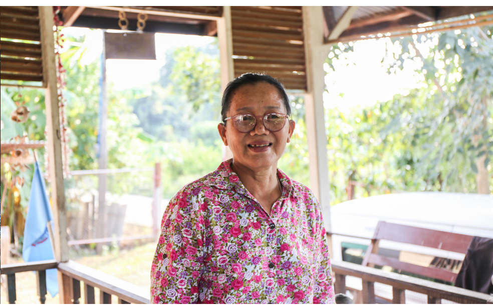
แคร์ กิฟเวอร์ จากทีมอาสาสายใจ ลงพื้นที่ดูแลและให้กำลังใจผู้สูงอายุติดเตียง