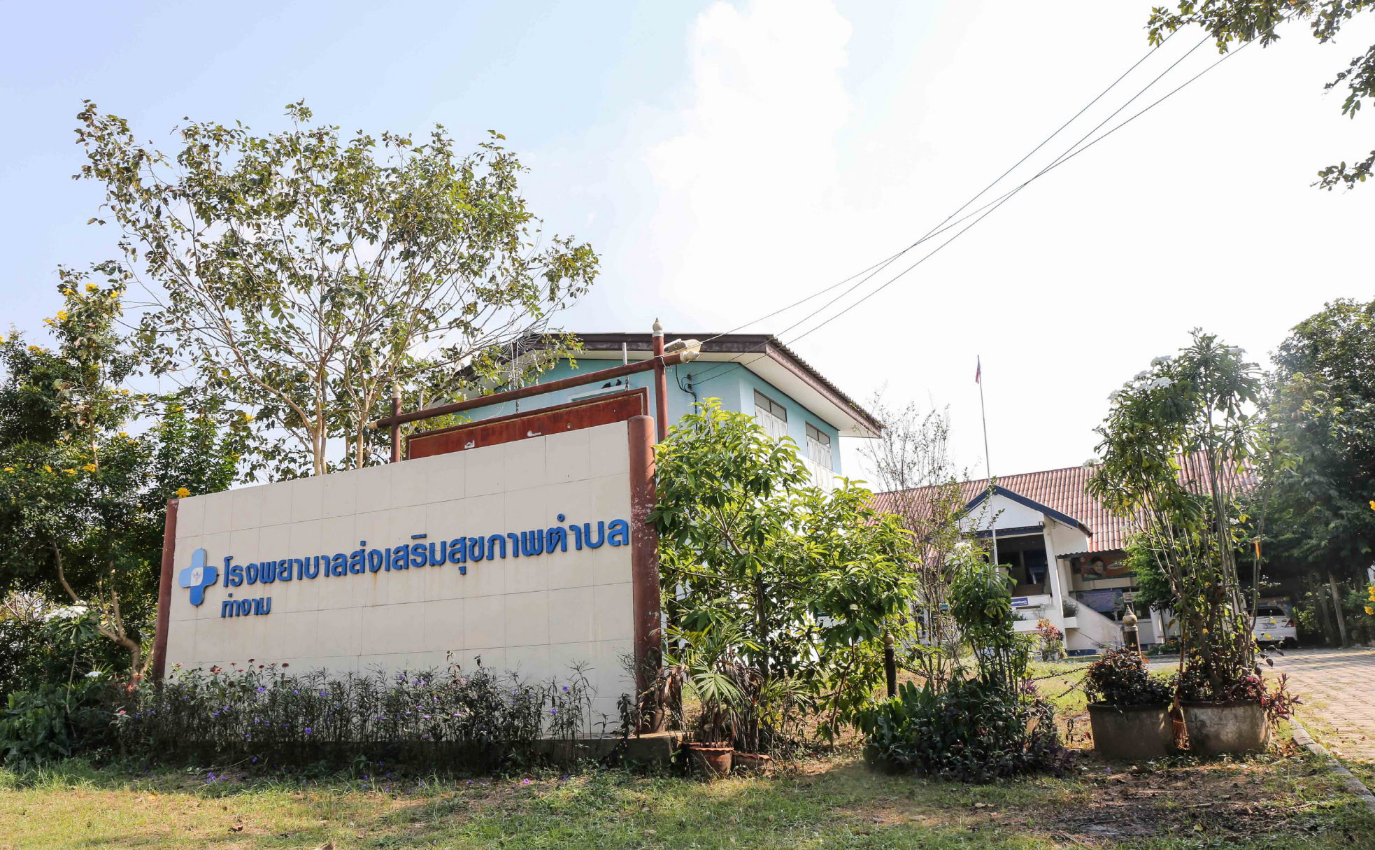
โรงพยาบาลส่งเสริมสุขภาพตำบลท่างาม ให้การรักษาและให้ความรู้ด้านการส่งเสริมสุขภาพกับชาวท่างาม