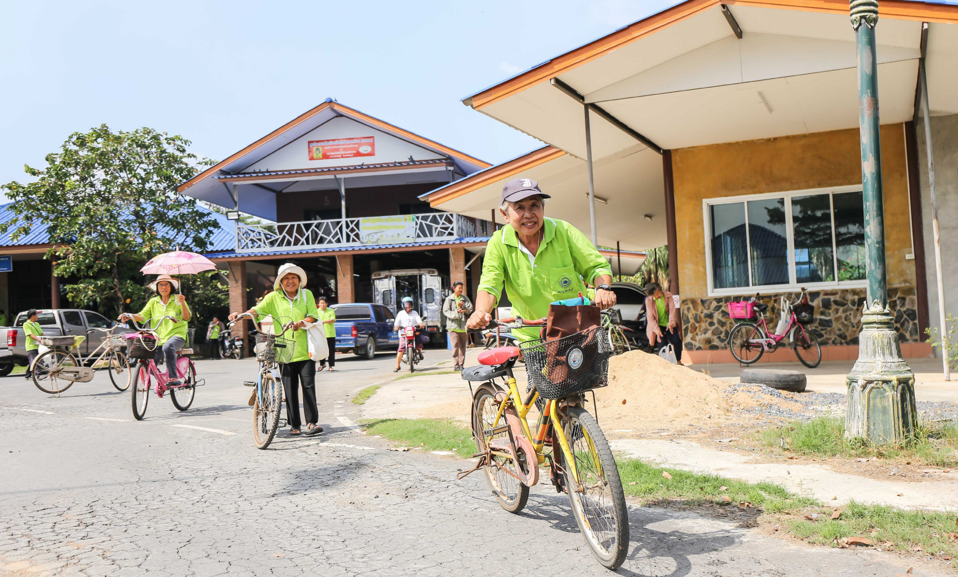
ผู้สูงอายุเดินทางมาเรียนด้วยการปั่นจักรยานและการเดิน