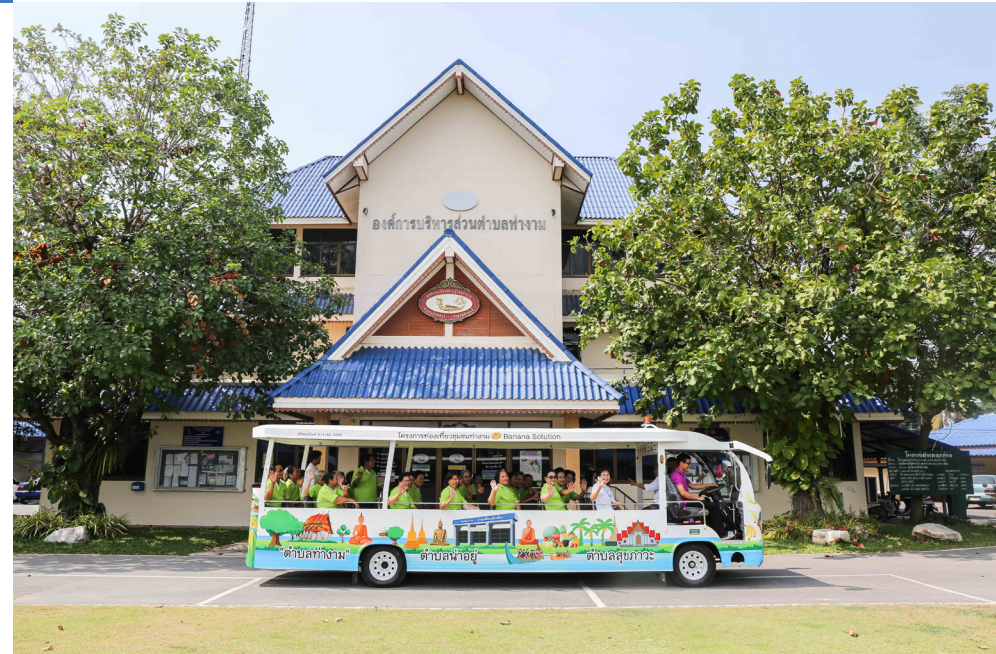
โครงการท่องเที่ยวชุมชนท่างาม

ความหมายของดอกล้าดวนในมุมมองของชาวท่างาม จึงเป็นมากกว่าแค่ดอกไม้ที่เป็นสัญลักษณ์ของผู้สูงอายุ แต่ยังหมายถึงความสุขในฐานะที่ได้เป็นชาวชุมชนท่างามอีกด้วย