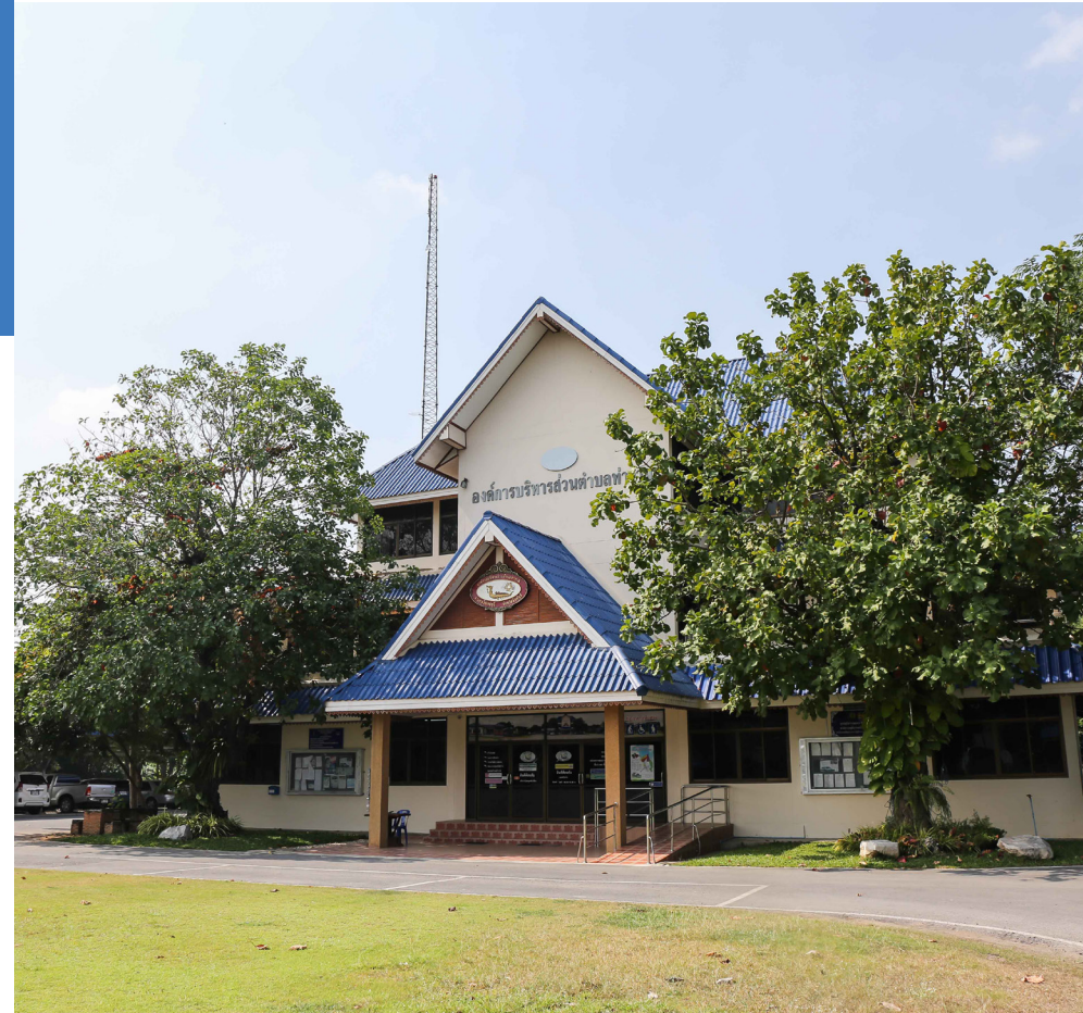
องค์การบริหารส่วนตำบลท่างาม จังหวัดสิงห์บุรี

แต่ปัญหาทุกอย่างก็เป็นไปอย่างเช่นทุกครั้งมา ชาวท่างามยังคงร่วมแรงร่วมใจแก้ปัญหาด้วยมุมมองที่เป็นบวกอยู่เสมอไม่เคยเปลี่ยน