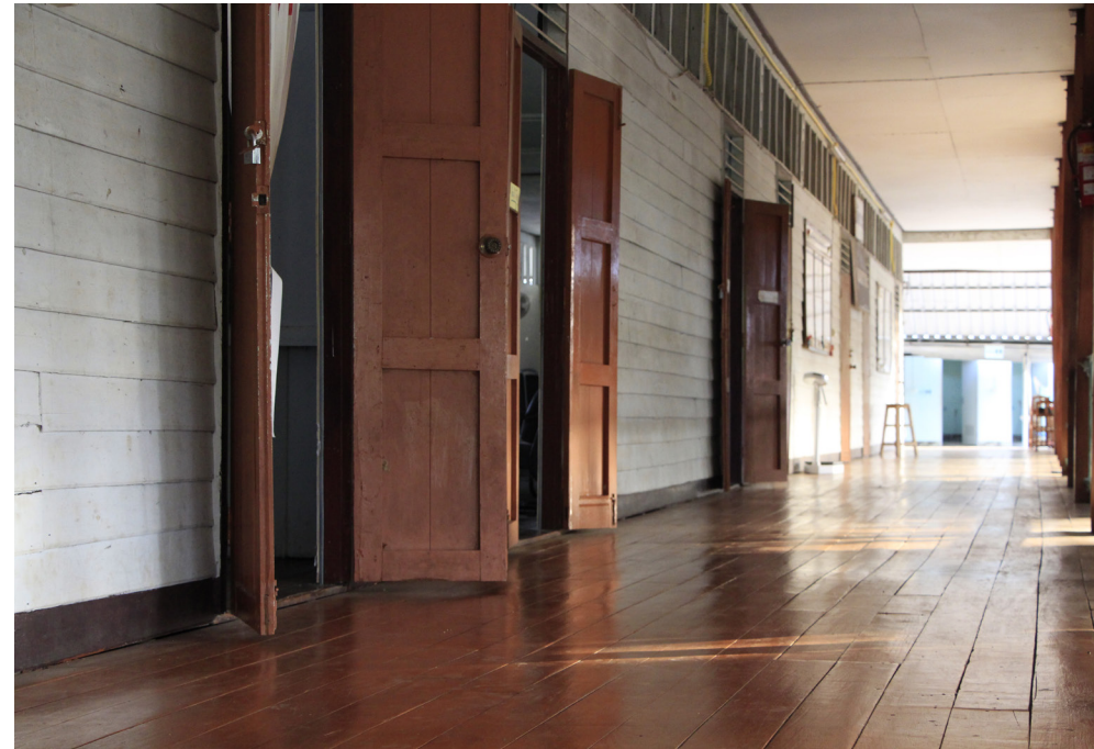
จากโรงเรียนบ้านสะเลียมใต้ถูกปรับให้กลายเป็นโรงเรียนผู้สูงอายุตำบลตำหนักธรรม

จะเห็นได้ว่าตลอดระยะเวลาหลายปีที่ผ่านมา ชุมชนตำบลตำหนักธรรม มีประสบการณ์การทำงานพัฒนาระบบการดูแลผู้สูงอายุอย่างต่อเนื่องผ่านการร่วมคิด ร่วมใจ ร่วมทำ ร่วมออกแบบ และร่วมรับผิดชอบต่อชุมชนของภาคีเครือข่ายต่าง ๆ เช่น หน่วยบริการสุขภาพ สำนักงานพัฒนาสังคมและความมั่นคงของมนุษย์จังหวัดแพร่ เครือข่ายภาคประชาชนในจังหวัด รวมไปถึงการสนับสนุนของสำนักงานกองทุนสนับสนุนการสร้างเสริมสุขภาพ (สสส.) ส่งผลให้ผู้สูงอายุของตำบลตำหนักธรรมมีคุณภาพชีวิตที่ดีขึ้นจนถึงปัจจุบัน