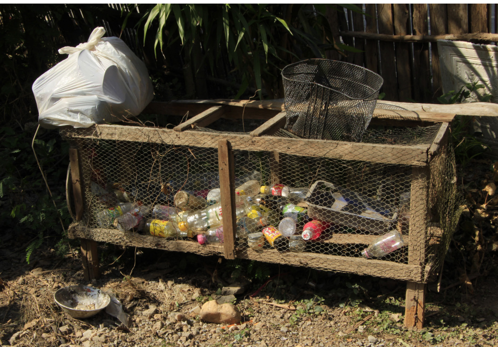
การคัดแยกขยะเป็นกิจกรรมที่ผู้สูงอายุให้ความสนใจและประสบความสำเร็จอย่างมาก

เมื่อจุดเริ่มต้นในโรงเรียนผู้สูงอายุประสบความสำเร็จเป็นอย่างดี โครงการคัดแยกขยะจึงได้มีโอกาสขยายออกไปยังชุมชนในวงกว้างมากขึ้นในเวลาต่อมา