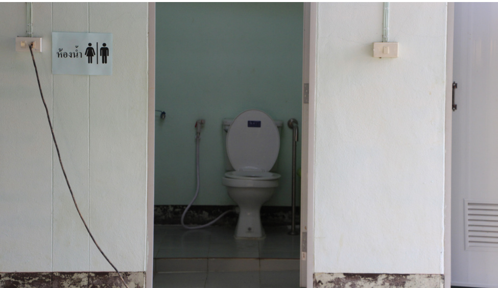
ตำบลตำหนักธรรมปรับปรุงห้องน้ำเพื่อให้ผู้สูงอายุใช้งานได้สะดวกขึ้น