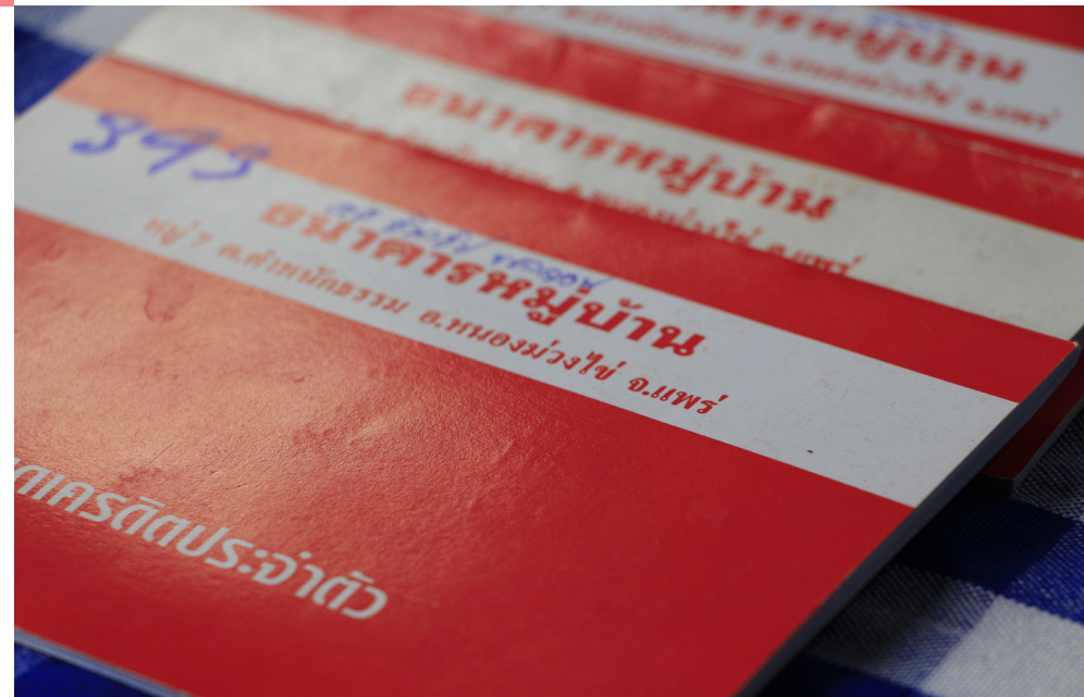
สมุดธนาคารหมู่บ้าน หมู่ 7 ตำบลตำบลนครธรรม

สถาบันการเงินอีกแห่งหนึ่งที่เป็นต้นแบบในการรณรงค์ให้กลุ่มผู้สูงอายุรู้จักการออมที่ได้เปิดดำเนินการมาหลายปีแล้วก็คือกลุ่มธนาคารหมู่บ้านหมู่ 7 ที่ก่อตั้งขึ้นโดยประธานธนาคารหมู่บ้านหมู่ 7 คุณลุงไข่ กาดัง อายุ 66 ปี เราจะคุยกับคุณลุงไข่ถึงที่มาที่ไปในการก่อตั้งธนาคารหมู่บ้าน และแนวทางในการดำเนินการเพื่อผลประโยชน์ของผู้สูงอายุของธนาคารแห่งนี้