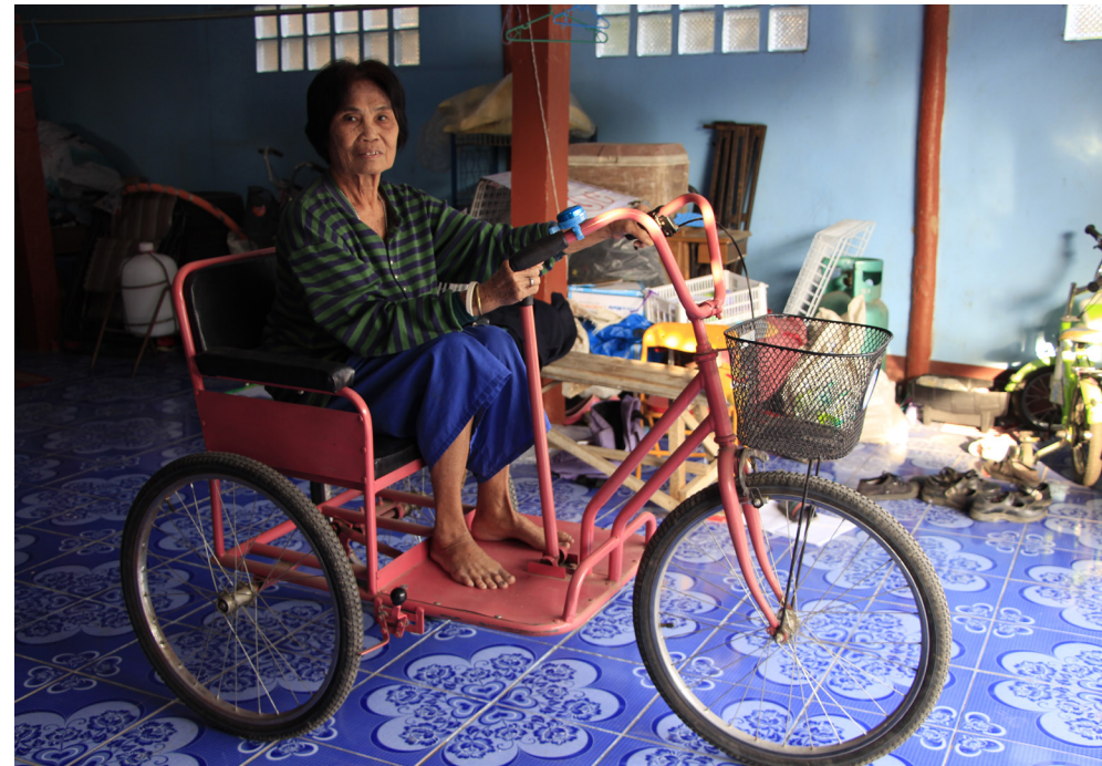
คุณยายกาดกับอุปกรณ์รถโยกที่ทำให้เดินทางละแวกบ้านได้สะดวกมากขึ้น