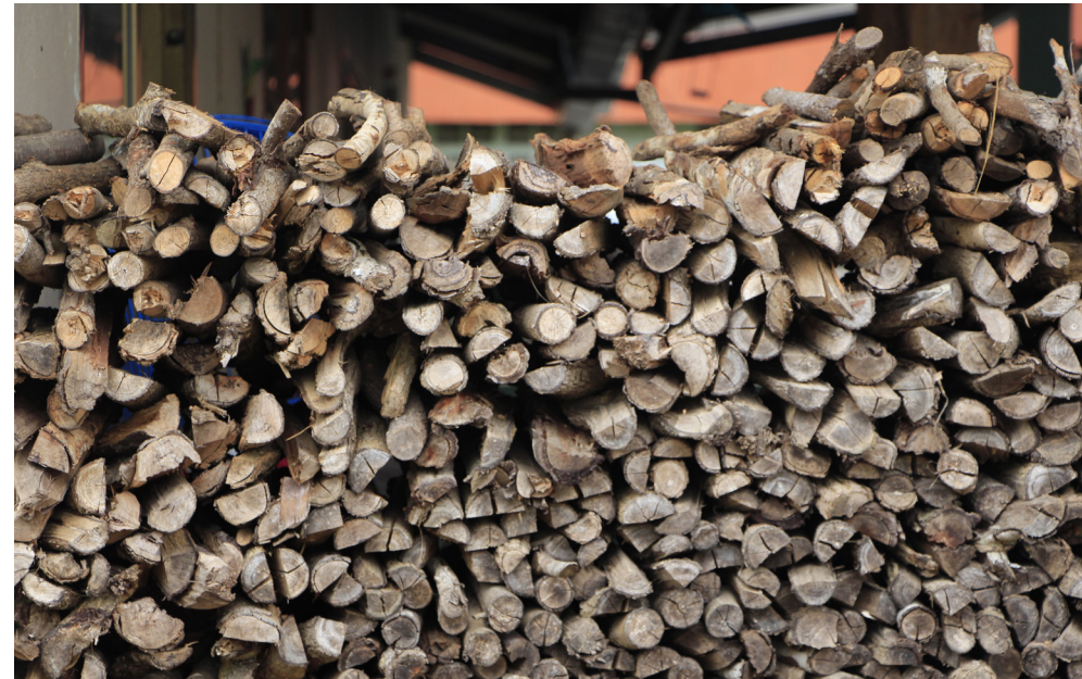
กองฟืนเรียงรายที่เตรียมไว้ใช้ตลอดปี

มีความสุข พอเราทำมันก็สบายใจ บ้านเราก็สะอาด สะอาด ถ้าเรานอนอยู่แล้วเห็นอะไรสกปรกเราก็ไม่สบายใจ ต้องลุกขึ้นมาเก็บ ก็เราอยู่ว่าง ๆ ไม่รู้จะทำอะไร ก็ทำไปเรื่อยนะ คนแก่ก็แบบนี้แหละนะ (หัวเราะ)