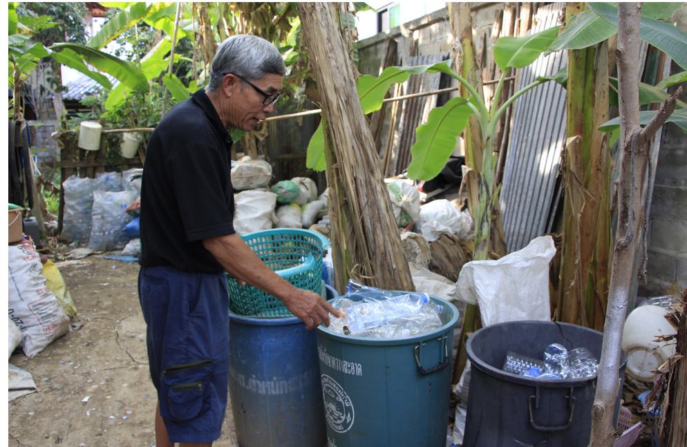
ลุงสงวนคัดแยกขยะเพื่อนำไปขายสร้างรายได้เสริมให้กับตนเอง และนำความรู้เรื่องขยะไปสอนให้กับคนในชุมชน

“ ตอนเริ่มทำใหม่ ๆ คนก็มาบอกว่าให้ไปเก็บขยะที่บ้านหน่อย เขาไม่ได้บอกให้ไปเก็บของเก่าครับ เพราะตอนนั้นเขายังคิดว่าขยะที่เขาทิ้ง เป็นของที่ไม่มีค่ากันอยู่ แต่ผมก็คิดว่าสิ่งที่เราทำมัน คือการช่วยพัฒนาบ้านเราด้วย มันไม่ใช่งานที่อาย สักหน่อย เราทำงานสุจริต ไม่ใช่งานที่อาย ”