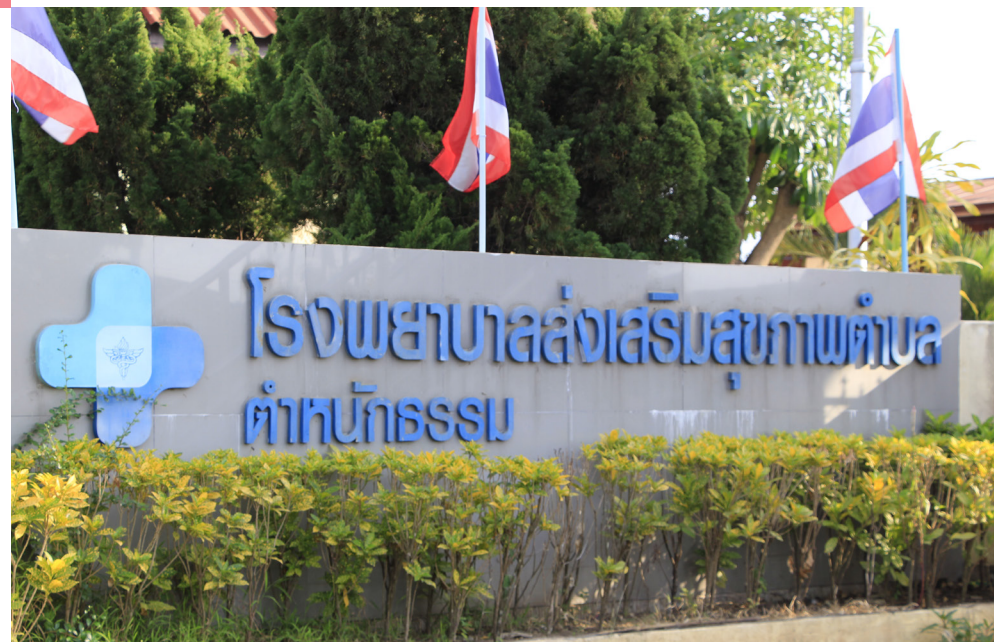
โรงพยาบาลส่งเสริมสุขภาพตำบล ตำบล ท้องถิ่น ให้บริการผู้สูงอายุโดยไม่ต้องรอคิว

แต่การบริการที่สำคัญมากที่สุดอีกอย่างหนึ่งก็คือ การจัดสภาวะ แวดล้อมที่เอื้อต่อสุขภาพของผู้สูงอายุ ทั้งการปรับปรุงสภาพบ้าน ให้กับผู้สูงอายุ จำนวน 15 หลังคา ก่อสร้างบ้านให้ผู้สูงอายุใหม่ จำนวน 1 หลัง ซ่อมถนน จำนวน 5 เส้น ทำลานกีฬา จำนวน 5 แห่ง และมีการทำทางลาดและที่จอดรถคนพิการและผู้สูงอายุในโรงเรียนผู้สูงอายุ