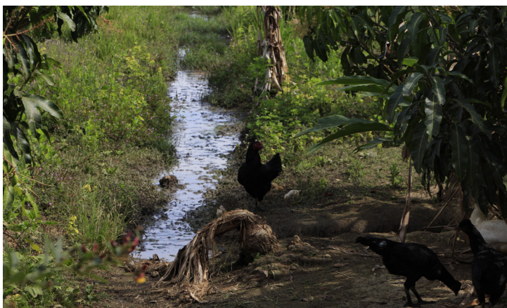
เกษตรทฤษฎีใหม่ รูปแบบของการทำเกษตรที่เหมาะสมกับเกษตรกรสูงอายุ