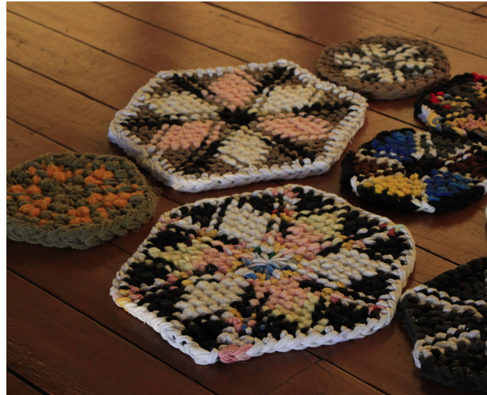
พรหมเชิดเท้าหลากสีหลายขนาด โดยฝีมือของนักเรียนจากโรงเรียนผู้สูงอายุตำบลตำหนักธรรม

ไม่ดูหรอกจ๊ะ (หัวเราะ) ใครอยากมาเรียน ยายก็สอนไป ไม่มีหวังวิชา เพราะเวลา เราเดินทางไปที่ไหนเราก็ไปลักร้างวิชา เขามา อย่างวิชาการทำพวงกุญแจผ้า นี้ยายก็จำมาจากทางเชียงรายเขา ตอนแรกบ้านเราบ่มี พอเราไปเห็น กิจกรรมเขา เราก็เอามาทำให้คนบ้านเรา มีรายได้ คนเฒ่าคนแก่บ้านเราก็มีอะไรทำ ไม่เหงา แม้อยู่ทุกวันก็ไม่ได้เหงา หลาน ไปโรงเรียนเราก็นั่งทำงาน มือไม่ได้หยุด เลย ทำงานตลอด