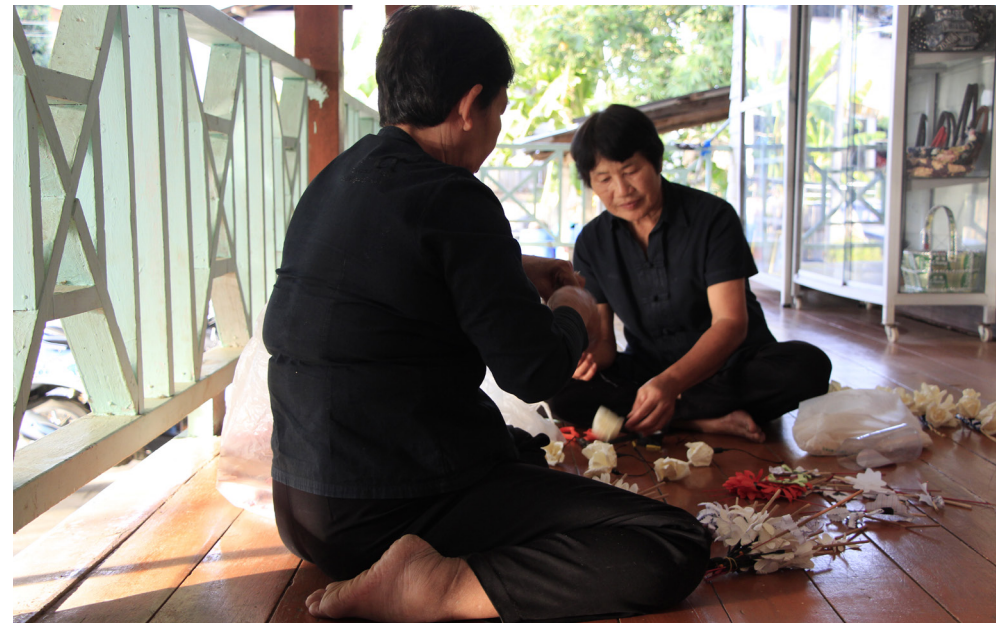
ผู้สูงอายุรวมกลุ่มทำดอกไม้จันทน์เพื่อสร้างรายได้ให้ตนเองและนำไปสนับสนุนกิจกรรมในชุมชน

ผลิตภัณฑ์เด่นของตำบลนครธรรมมีอยู่ด้วยกันหลายอย่าง อาทิ กระเป๋าสานพลาสติก ราคา 400-600 บาท พรมเช็ดเท้า ผืนละ 30 บาท ที่รองเขียงและครก ราคา 10-15 บาท เพลนอน ราคา 100 บาท ซึ่งผลิตภัณฑ์ทั้งหมดสามารถสร้างรายได้ให้ตำบลนครธรรมได้ปีละ หลายล้านบาท สามารถนำเงินจำนวนนี้ไปพัฒนาชุมชนได้ในหลายมิติ