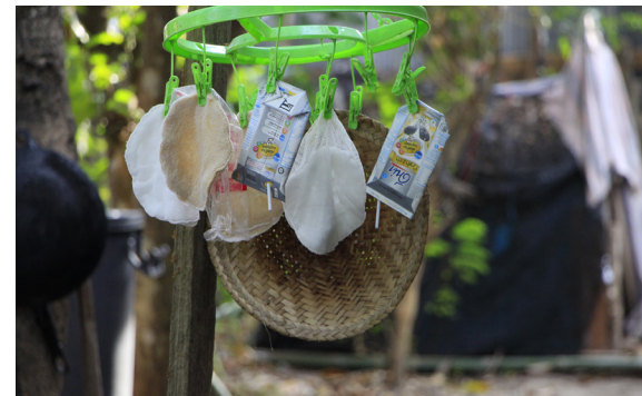
การคัดแยกขยะบางชิ้นเพื่อนำมารีไซเคิล ทำให้ผู้สูงอายุสามารถใช้ประโยชน์จากสิ่งของเหลือใช้ต่อได้

นอกจากนั้นการมีมาตรการกำหนดให้ทุกครัวเรือนนำขยะมาทิ้งในวันเวลาและสถานที่ที่กำหนด ก็ได้ก่อให้เกิดปฏิสัมพันธ์ขึ้นในชุมชน มีการทักทายพบปะกันในเวลาที่เอาขยะมาทิ้งด้วยกัน สร้างความสนุกสนานให้กับกลุ่มผู้สูงอายุในการพูดคุยแลกเปลี่ยนเรื่องน้ำหนักขยะของแต่ละบ้าน รวมไปถึงสร้างการเรียนรู้ด้านการจัดการขยะที่มากขึ้น เพราะเมื่อ อบต. สามารถประหยัดงบประมาณในการจัดการขยะได้มากพอสมควรจนมีงบประมาณเหลือ จึงได้จัดให้มีการทัศนศึกษาเรียนรู้ดูงานด้านการจัดการขยะในชุมชนอื่น ๆ ก่อให้เกิดการแลกเปลี่ยนระหว่างชุมชน นำข้อดีของชุมชนอื่นมาทดลองใช้ ซึ่งส่งผลให้เกิดการจัดการขยะที่ดีขึ้นต่อไปในแต่ละชุมชนในอนาคต