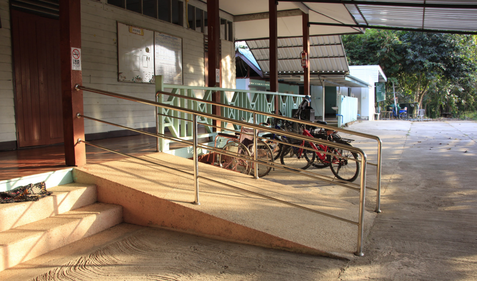
ทางลาดชันสำหรับอำนวยความสะดวกแก่ผู้สูงอายุ