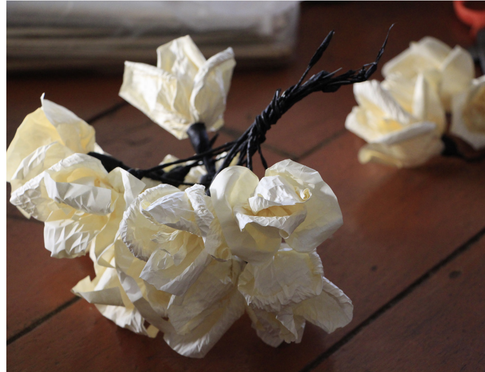
ดอกไม้จันทน์จากฝีมือของนักเรียนโรงเรียนผู้สูงอายุตำบลตำหนักธรรม

ได้มีประสบการณ์เพิ่มจ้ะ อะไรที่ไม่เคยทำก็ทำ ได้ใช้เวลาว่างให้เป็นประโยชน์