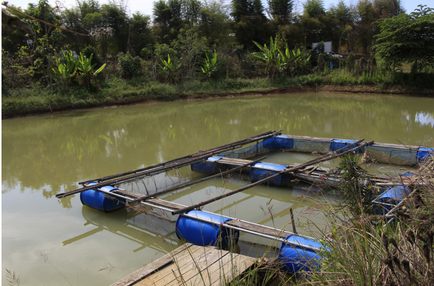
ความรู้จากเกษตรทฤษฎีใหม่ โดยการขุดสระให้ลึกสำหรับเก็บน้ำและแบ่งไว้เพื่อเลี้ยงปลา