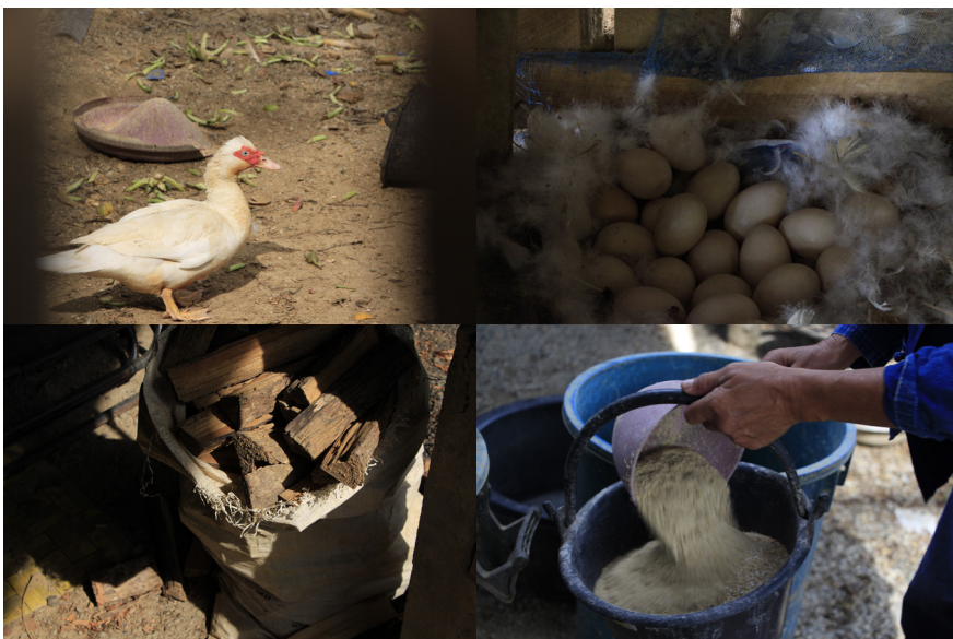
วิถีชีวิตในสวนเกษตรทฤษฎีใหม่ของคุณปากันยา

คนอื่น ๆ ประสบปัญหาในการทำนาทำสวนพอสมควรในหน้าแล้ง เพราะไม่มีสระน้ำเป็นของตนเอง