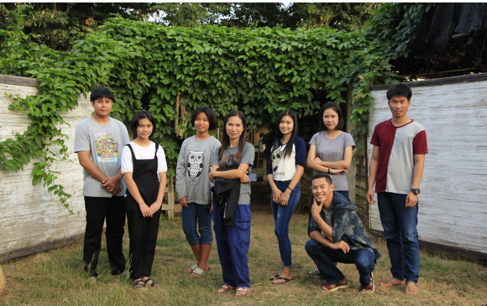
ผู้มีส่วนร่วมและผลักดันให้ผู้สูงอายุตำบลตำหนักธรรมมีชีวิตที่ดีขึ้น