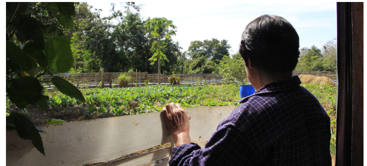
ผู้สูงอายุตำบลตำหนักธรรมส่วนใหญ่ประกอบอาชีพเกษตรกร

ไม่เพียงแต่ผู้สูงอายุเท่านั้นที่ได้มาพบปะกัน แต่กลุ่มเจ้าหน้าที่หน่วยงานต่าง ๆ ในชุมชนก็ยังได้ใช้กิจกรรมในโรงเรียนผู้สูงอายุเป็นจุดพบปะเพื่อร่วมแรงร่วมใจในการทำงานเพื่อผู้สูงอายุอย่างเต็มที่ ทั้งกลุ่มจิตอาสาที่ทำหน้าที่ในการดูแลผู้สูงอายุระหว่างการเรียนและทำกิจกรรมตลอดทั้งวัน เจ้าหน้าที่จาก อบต. ตำหนักธรรมที่คอยทำหน้าที่ขับรถรับส่งผู้สูงอายุทั้งในยามาและขากลับ เจ้าหน้าที่วิทยากรอาสาสมัครต่าง ๆ ซึ่งทุกคนล้วนแต่ทำงานด้วยใจเพื่อให้ผู้สูงอายุมีคุณภาพชีวิตที่ดีขึ้นนั่นเอง