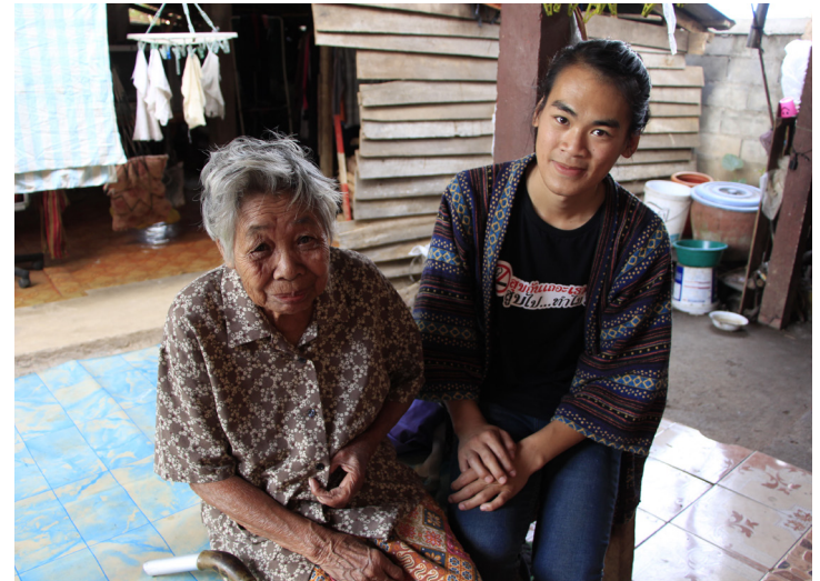
แอสว กันธหมื่น อายุ 78 ปี

เราจะตามจอนนี่ออกไปทำหน้าที่ แคร่ กิฟเวอร์ ดูแลคุณยายทั้งสองคนด้วยกัน