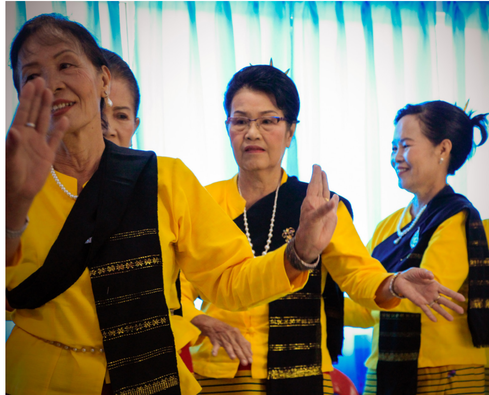
การฟ้อนรำเป็นกิจกรรมนันทนาการที่ผู้สูงอายุสนใจเป็นอย่างยิ่ง