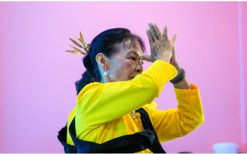
กิจกรรมฟ้อนรำ เป็นหนึ่งมรดกทางวัฒนธรรมที่ตั้งใจถ่ายทอดให้คนรุ่นต่อไป