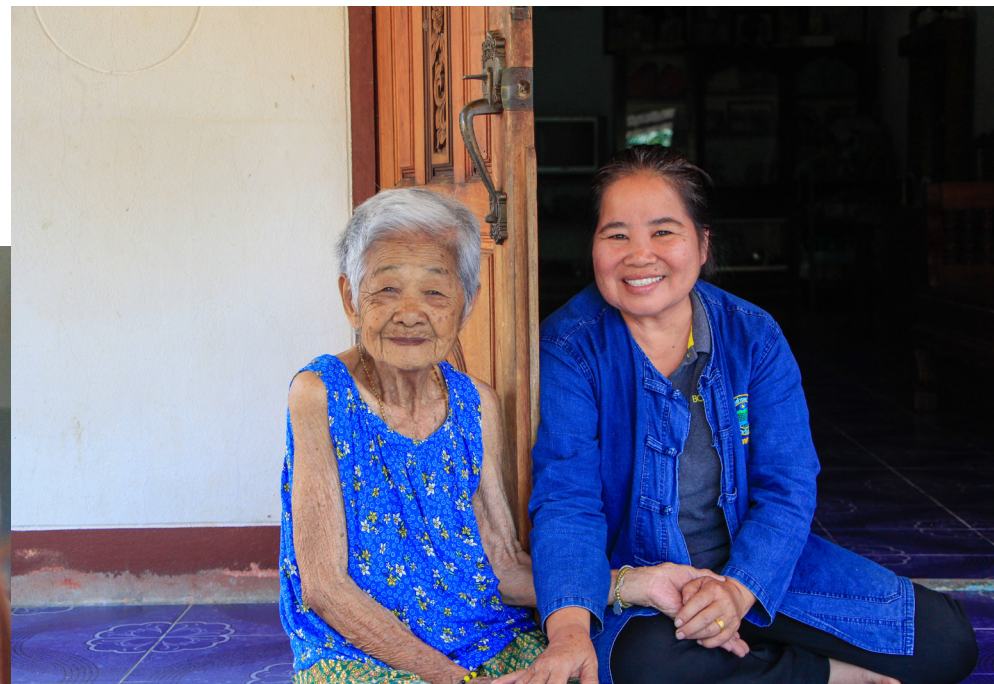
นอกจากเจ้าหน้าที่แคร์ กิฟเวอร์จะเข้ามาตรวจวัดร่างกายโดยทั่วไปแล้ว ยังมาช่วยดูแลความสะอาดร่างกายและบ้านด้วย