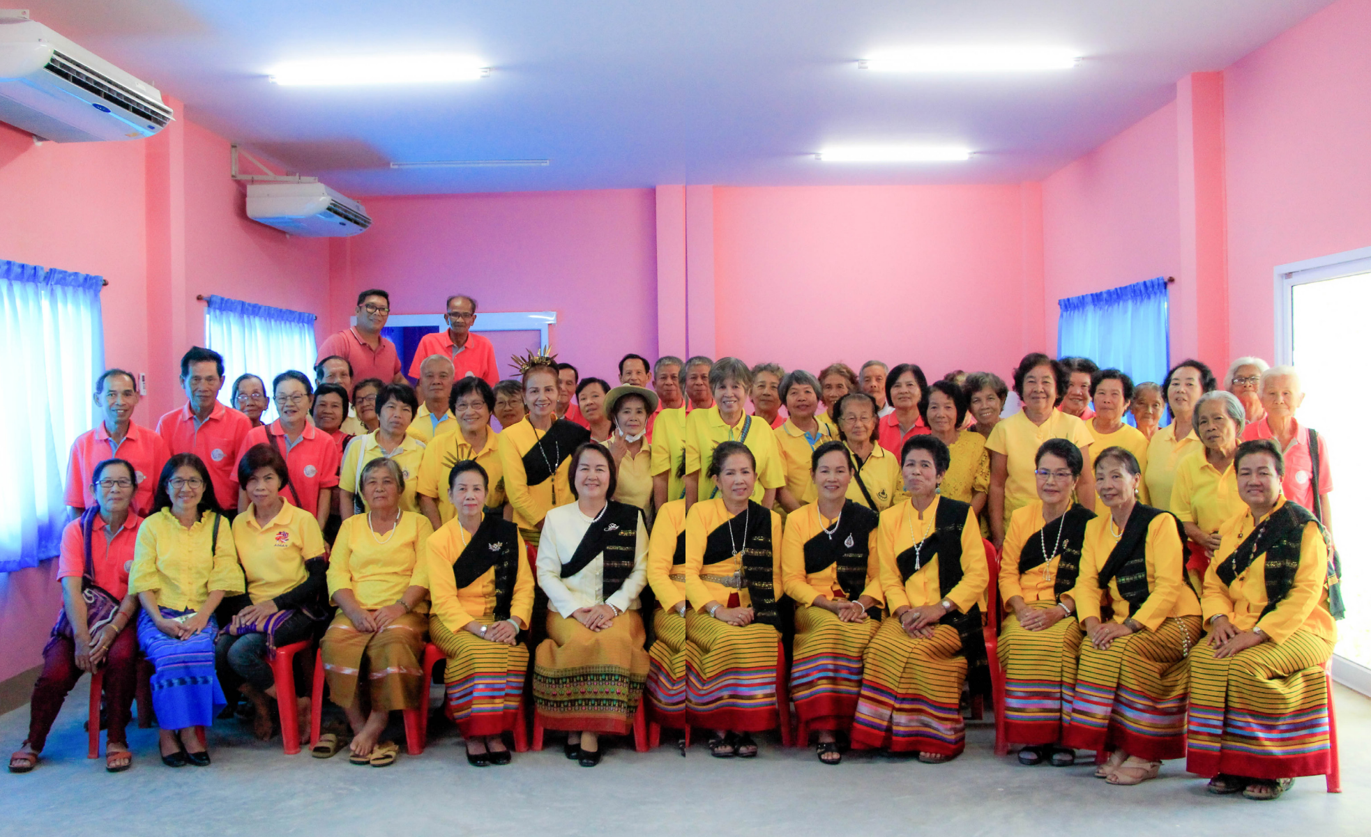
รอยยิ้มและความสุขที่เกิดขึ้นจากการมาโรงเรียนผู้สูงอายุ