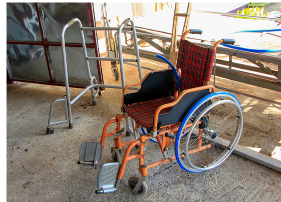
กายอุปกรณ์ที่ได้รับการซ่อมแซมและพัฒนาขึ้น ภายในศูนย์ซ่อมบำรุงฯ ช่วยประหยัดงบประมาณให้กับผู้สูงอายุได้มาก