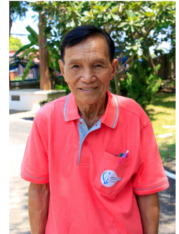
เมือง เมือง