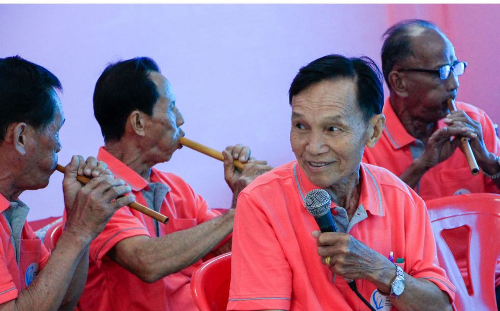
คณะซอสีทวน ดนตรีพื้นบ้านที่สุใจทั้งคนเล่นและคนฟัง