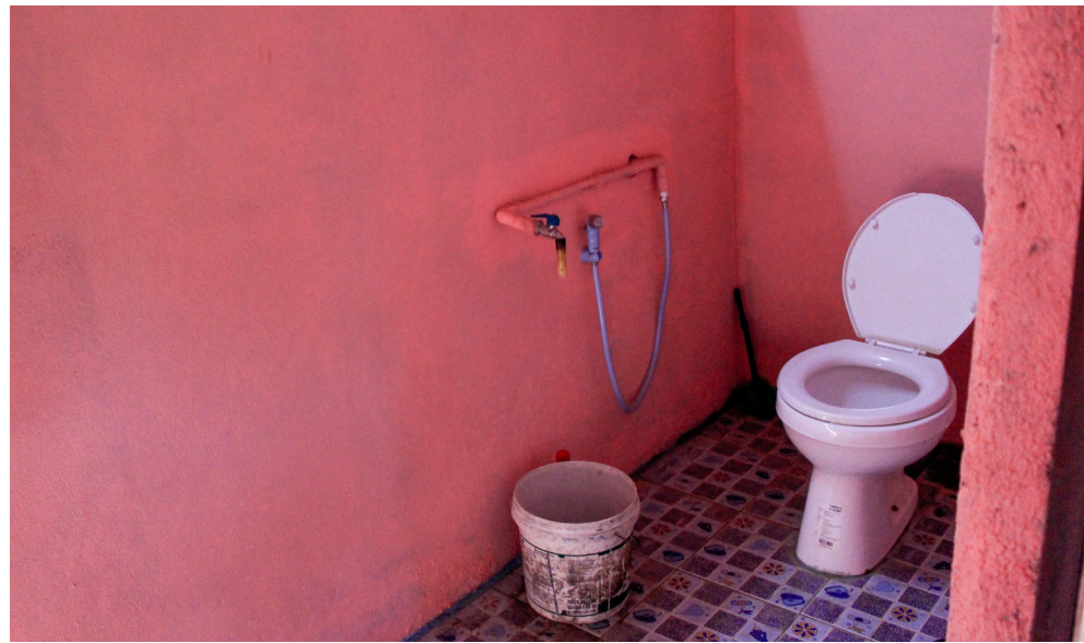
ภาพบน: ห้องน้ำก่อนปรับปรุง ภาพล่าง: สภาพห้องน้ำที่ปรับปรุงให้ใช้งานได้สะดวกกว่าเดิม