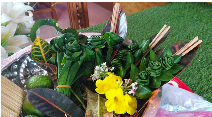
ตัวอย่างงานฝีมือที่ กศน. เข้ามาส่งเสริม ซึ่งเกิดจากความต้องการในหมู่ผู้สูงอายุ

“ทุกคนเขาสนุกกับการเรียน อยากมีส่วนร่วม เขาอยากจะทำประยุกต์ อยากเห็นอะไรที่มันแปลกใหม่ วัสดุที่ใช้ในการเรียนแต่ละสัปดาห์ ใครมี วัสดุอะไรก็นำมาทำเอง บางคนมีมะกรูด มีใบเตยก็เอามาแบ่งปันคนที่ ไม่มี” ครู กศน. เสริมงามเล่าบรรยากาศในห้องเรียน