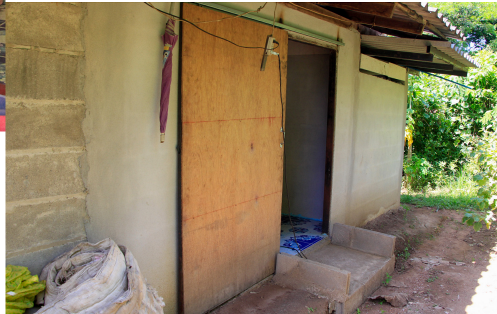
สภาพบ้านของคุณลุงจันต๊ีบหลังได้รับการปรับปรุงสภาพให้มีความสะดวกในการดำเนินชีวิตมากขึ้น

คุณต๋ัยบอกว่า ก่อนหน้านี้สภาพความเป็นอยู่ค่อนข้างไม่สะดวกเพราะคุณลุงจะต้องนอนในห้องนอน ซึ่งไกลจากห้องน้ำ ต่อมาเทศบาลได้เข้ามาช่วยปรับปรุงสภาพบ้าน โดยการต่อห้องนอนใหม่และทำห้องน้ำไว้ในบริเวณเดียวกัน ทำให้ไม่ต้องย้ายคุณลุงไปมา ทำให้ครอบครัวสามารถดูแลคุณลุงจนดีได้สะดวกขึ้นมาก