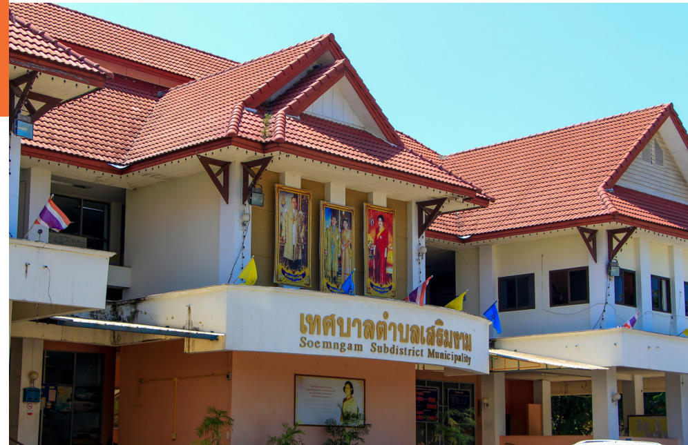
เทศบาลตำบลเสริมงาม ศูนย์กลางการขับเคลื่อนงานด้านต่าง ๆ

เทศบาลตำบลเสริมงาม อำเภอเสริมงาม จังหวัดลำปาง เป็นหน่วยงานราชการบริหารส่วนท้องถิ่น เดิมเป็นสุขาภิบาลเสริมงาม จัดตั้งขึ้นเมื่อวันที่ 8 กุมภาพันธ์ พ.ศ. 2519 ต่อมาเมื่อมีพระราชบัญญัติเปลี่ยนแปลงฐานะของสุขาภิบาลเป็นเทศบาล พ.ศ. 2542 มีผลทำให้สุขาภิบาลเสริมงามเปลี่ยนแปลงฐานะเป็นเทศบาลตำบลเสริมงาม เมื่อวันที่ 25 พฤษภาคม พ.ศ. 2542 มีพื้นที่ครอบคลุม 3 ตำบล 2 หมู่บ้าน คือ ตำบลทุ่งงาม หมู่ที่ 2 บ้านนาบอน, หมู่ที่ 4 บ้านมั่ว, หมู่ที่ 6 บ้านดอนแก้ว, หมู่ที่ 8 บ้านดอนงาม, หมู่ที่ 11 บ้านทุ่งงามพัฒนา ตำบลเสริมกลาง หมู่ที่ 5 บ้านศรีลังกา, หมู่ที่ 6 บ้านฮ่องฮี, หมู่ที่ 7 บ้านนาเอียง, หมู่ที่ 8 บ้านทุ่งต่ำ, หมู่ที่ 9 บ้านสบเสริม, ตำบลเสริมซ้าย หมู่ที่ 7 บ้านน้ำเหลว, หมู่ที่ 3 บ้านทุ่งงาม เป็นชุมชนกึ่งชนบทกึ่งเมือง มีวิถีชีวิตเรียบง่ายหลายปีที่ผ่านมาาระบบสังคมของตำบลทุ่งงาม ตำบลเสริมกลาง ตำบลเสริมซ้าย เริ่มจะเป็นสังคมเดี่ยวน่าชื่น การปฏิสัมพันธ์แบบดั้งเดิมเมื่อครั้งสมัยปู่ย่าตายายลดน้อยลง และพบว่าผู้สูงอายุมักถูกทอดทิ้งให้เป็นผู้เลี้ยงหลานอยู่ในชุมชน เนื่องจากบุตรหลานไปทำงานที่ต่างจังหวัดและต่างประเทศ โดยมีแนวโน้มที่จะเพิ่มจำนวนสูงขึ้นเรื่อยๆ เป็นจุดเริ่มต้นของปัญหาที่คาดไม่ถึงที่กำลังเข้ามาเยือนเสริมงามอย่างรวดเร็ว