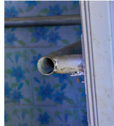
การปรับชั้นบันไดให้เตี้ยลงและมีหลายระดับมากขึ้น และการติดราวจับในห้องน้ำช่วยลดความเสี่ยงในการเกิดอุบัติเหตุกับผู้สูงอายุได้มาก