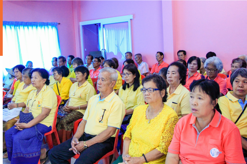
นักเรียนโรงเรียนผู้สูงอายุเข้าร่วมกิจกรรมอย่างตั้งใจ

สิ่งที่สำคัญคือ โรงเรียนแห่งนี้เมื่อเรียนจบวันหนึ่งแล้ว คุณครู และนักเรียนจะมาตกลงกันว่าบทเรียนครั้งต่อไปควรเป็นเรื่องอะไร เพื่อทำการวางแผนการเรียนการสอนร่วมกัน ทั้งนี้ก็เพื่อให้คุณครูผู้จัดการเรียนการสอนสามารถไปเตรียมบทเรียนและอุปกรณ์การเรียนการสอนได้ ขณะเดียวกันก็ทำให้นักเรียนผู้สูงอายุได้เรียนในสิ่งที่ตนเองสนใจที่สุด อันจะทำให้มีความสุข นำกลับไปใช้ประโยชน์พัฒนาศักยภาพได้อย่างแท้จริง