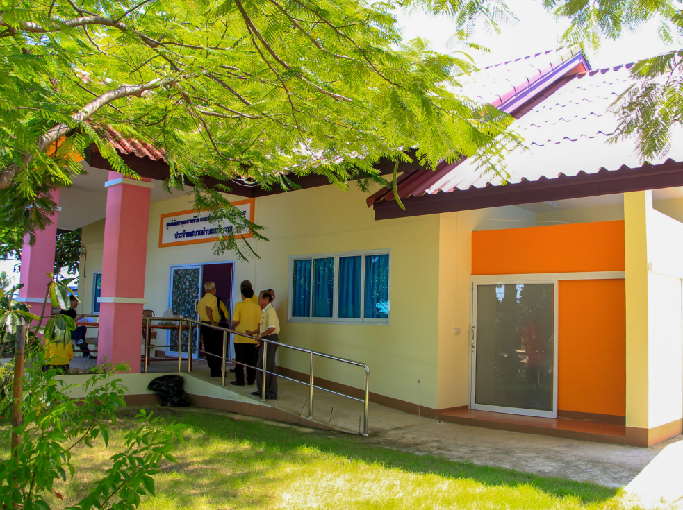
ศูนย์พัฒนาคุณภาพชีวิต ที่ตั้งโรงเรียนผู้สูงอายุ