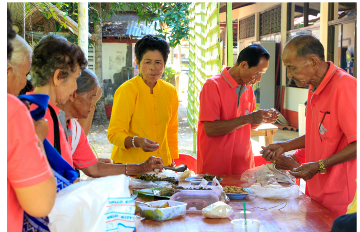
การรับประทานอาหารร่วมกันเป็นการกระชับความสัมพันธ์ของผู้สูงอายุในชุมชนที่ดีที่สุด

เราจึงสามารถกล่าวได้ว่า โรงเรียนผู้สูงอายุแห่งเทศบาลตำบลเสริมงาม ไม่ได้เป็นเพียงแค่สถานที่ แต่ยังหมายถึงผู้คนและกิจกรรมที่มุ่งหมายให้ผู้สูงอายุมีคุณภาพชีวิตที่ดีขึ้นทุกครั้งที่มา