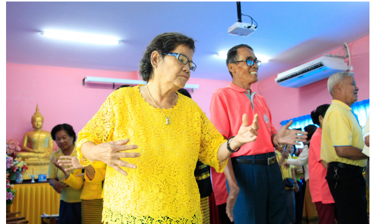
เมื่อผู้สูงอายุได้รับการถ่ายทอดความรู้เรื่องสุขภาพ จึงตระหนักในการดูแลสุขภาพด้วยการออกกำลังกายมากขึ้น

เรื่องเกี่ยวกับจารีตประเพณี ที่ผ่านมาสมาชิกให้ความสนใจมาก ก็คงจะเพิ่มตรงนั้นเข้าไปอีก รวมถึงสมาชิกที่มาโรงเรียน มันยังพัฒนาไปได้มากกว่านี้ขึ้นเยอะ ในอนาคตเรามีโครงการที่จะเคลื่อนออกไปต่างตำบล เพื่อไปทำกิจกรรมจุดประกายให้แต่ละเทศบาลมีกลุ่มของเขาเพิ่มขึ้น และกลุ่มเราถ้ามีวิทยากร เราก็ดึงไปกระจายความรู้ในพื้นที่ หรือถ้าเราไปเห็นว่าเขามีอะไรที่ดี ๆ เราก็ดึงมาใช้ที่นี่ได้