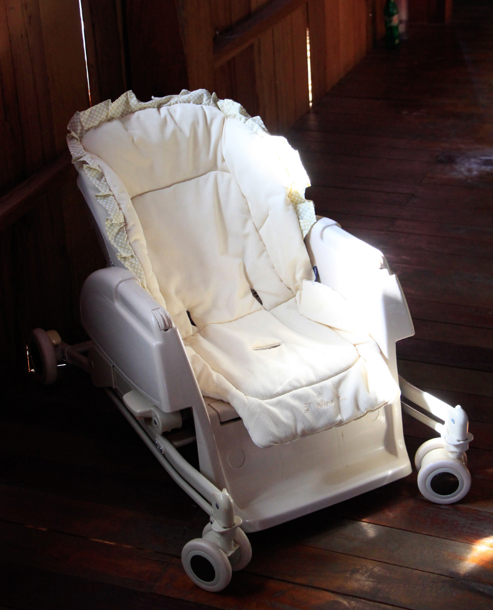
คุณดวงจันทร์ ยะเป็ียง เป็นผู้พิการที่มีร่างกายเล็กผิวดกปกติ จึงต้องใช้รถเข็นสำหรับเด็กในการเคลื่อนย้าย